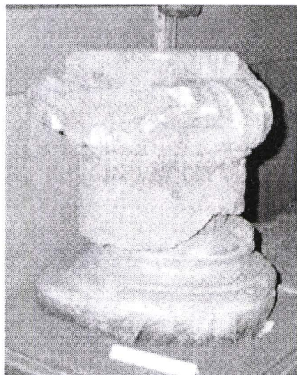
Monumente sculpturale romane de la Ulpia Traiana Sarmizegetusa la Poiana (județul Gorj) miel și două capiteluri