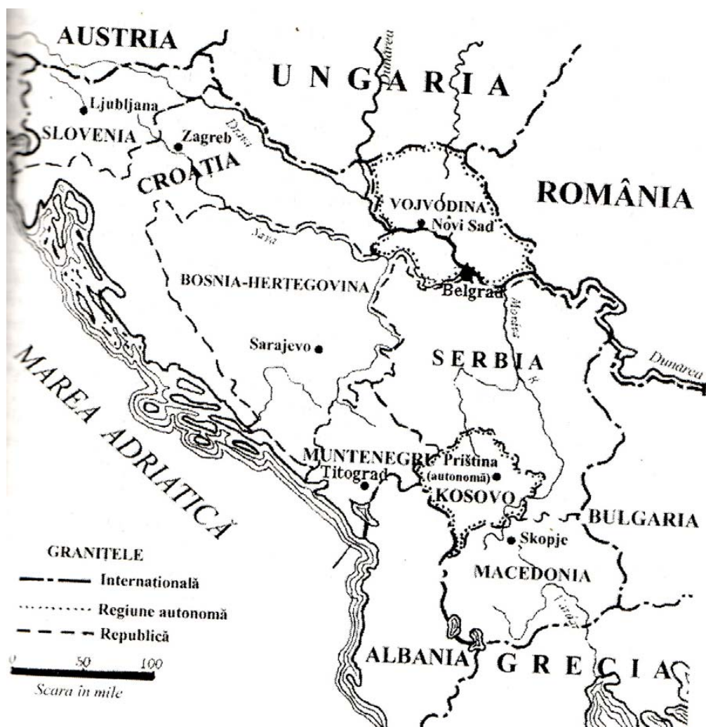
Fig 4. Iugoslavia postbelică: înființarea federației