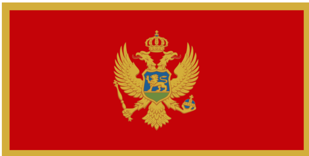
Fig. 7 Steagul actual al Republicii Muntenegru