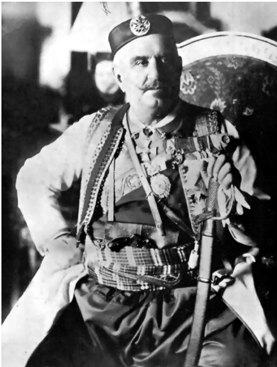
Fig. 8 Principele Nikola (1860-1910) proclamat rege al Muntenegrului (1910-1916)