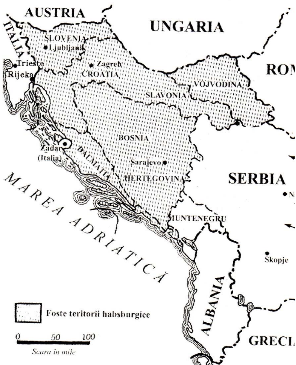
Fig 2. Iniințarea Regatului sîrbilor, croaților și slovenilor