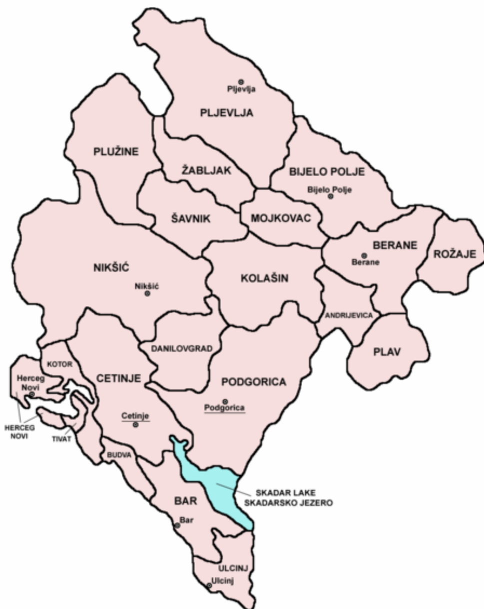
Fig. 5 Harta administrativă a Republicii Muntenegro