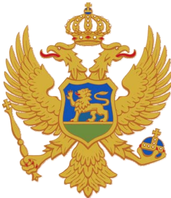
Fig. 6 Stema Republicii Muntenegru