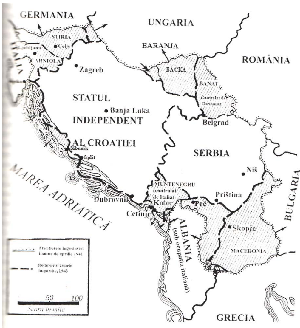
Fig 3. Împărțirea Iugoslaviei