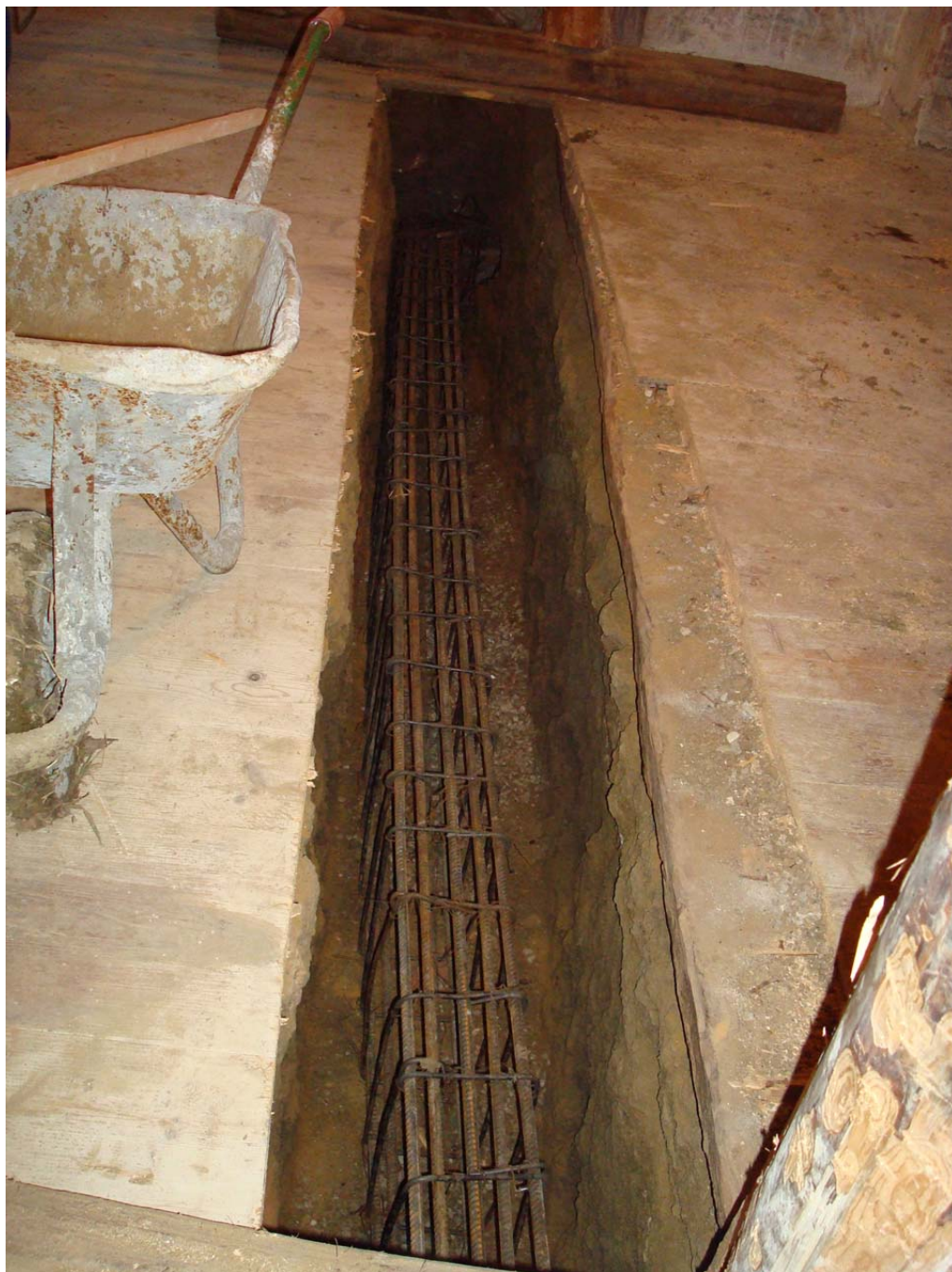
Pl. IV: Mănăstirea Strâmba-Jiu Aspect de săpătură