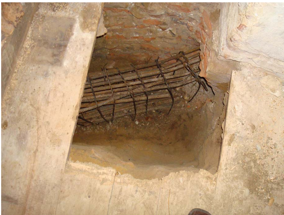
Pl. V: Mănăstirea Strâmba-Jiu Aspect de săpătură