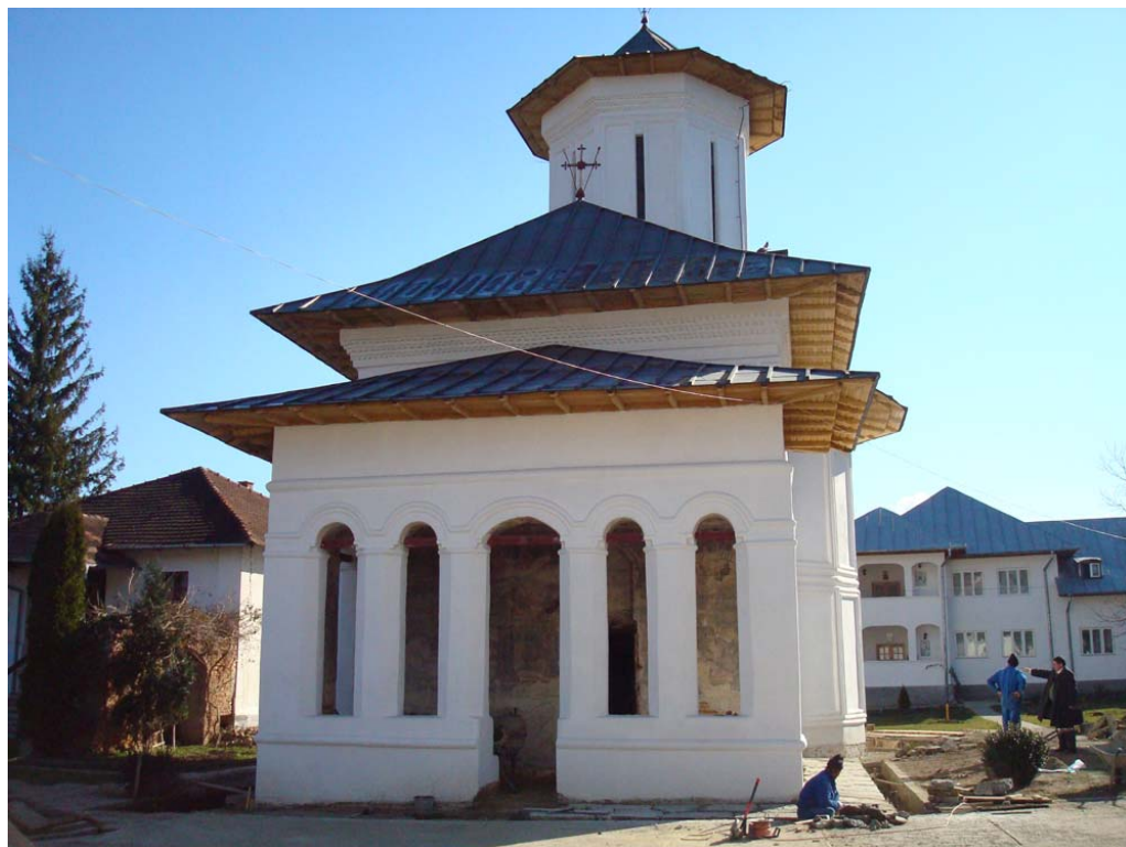
Pl. I: Mănăstirea Strâmba-Jiu