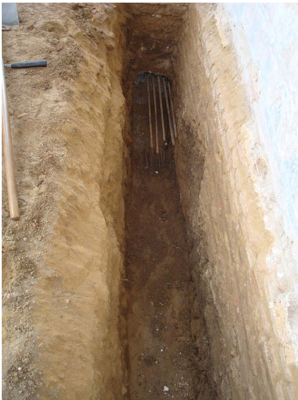
Pl. III: Mănăstirea Strâmba-Jiu. Aspect de săpătură