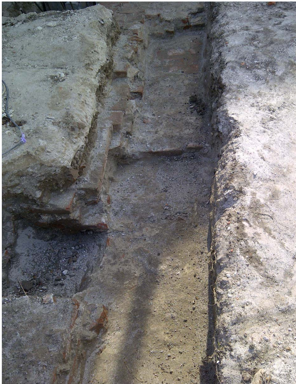
Aspect de săpătură arheologică preventivă