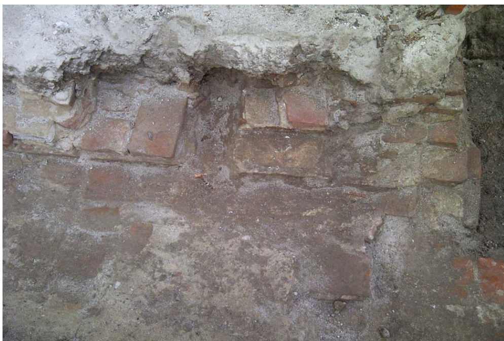
Aspect de săpătură arheologică preventivă