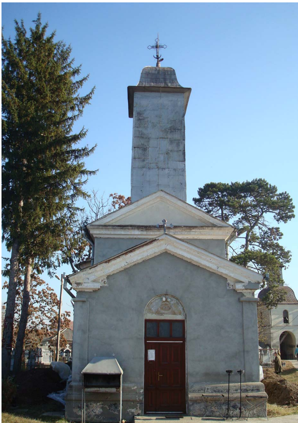
Vedere generală. Biserica „Sfinții Voievozi”.