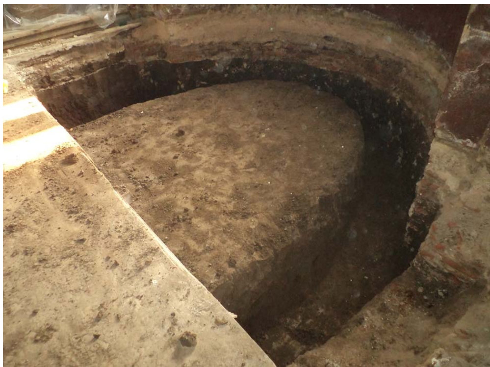
Aspect de săpătură arheologică preventivă