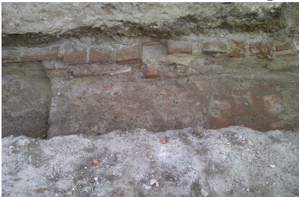
Aspect de săpătură arheologică preventivă