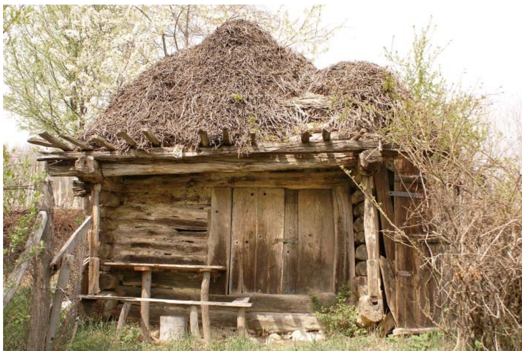
PIMNITA ACOPERITA CU VREJURI DE VITA DE VIE BOTA