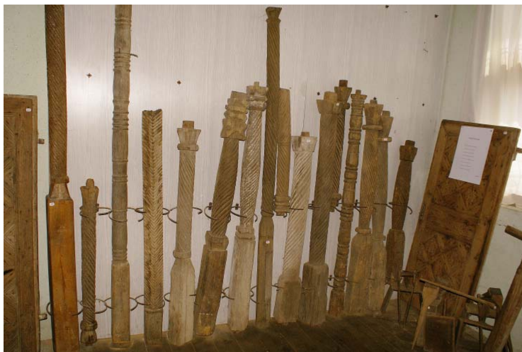
COLECTIE DE STALPI MUZEUL DIN ARCANI