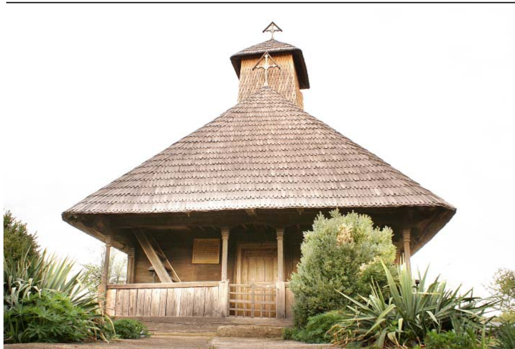
BISERICA DIN PESTISANI