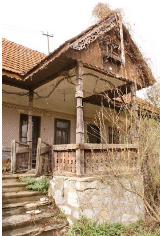
PRIDVOR CASA ARCANI