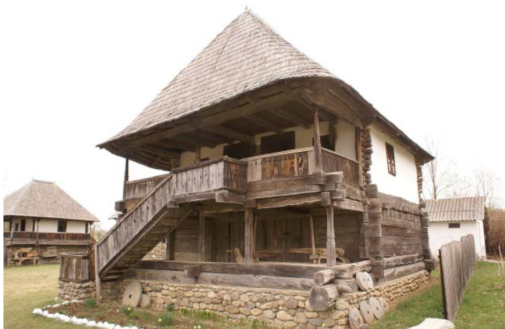
CASA COLTESCU MUZEUL CURTISOARA