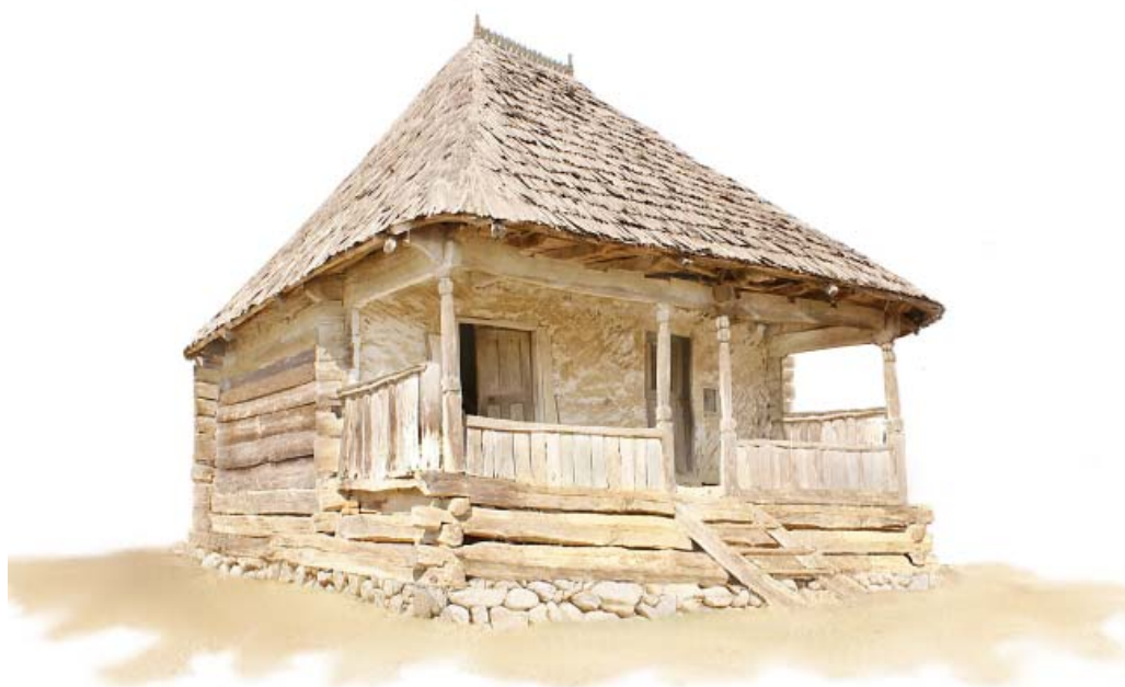
PERSPECTIVA CASA BUMBESTI - PITIC arh CRISTIAN NANU