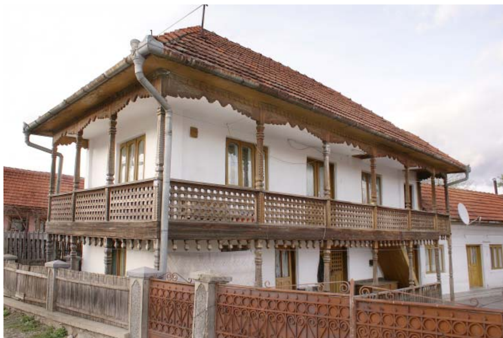
CASA JUMATATEA SEC XX PESTISANI