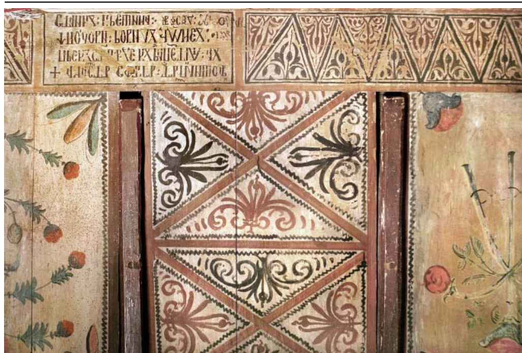
BISERICA DIN PESTISANI DETALIU PICTURA PRONAOS