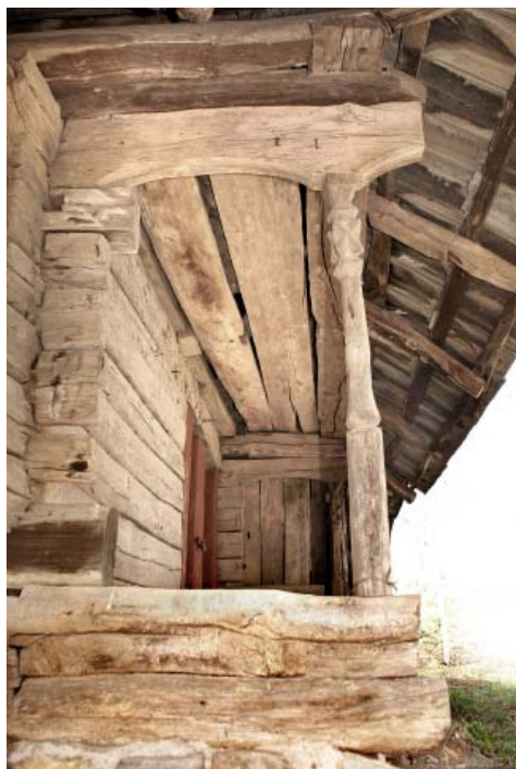
DETALIU PIMNITA BOTA