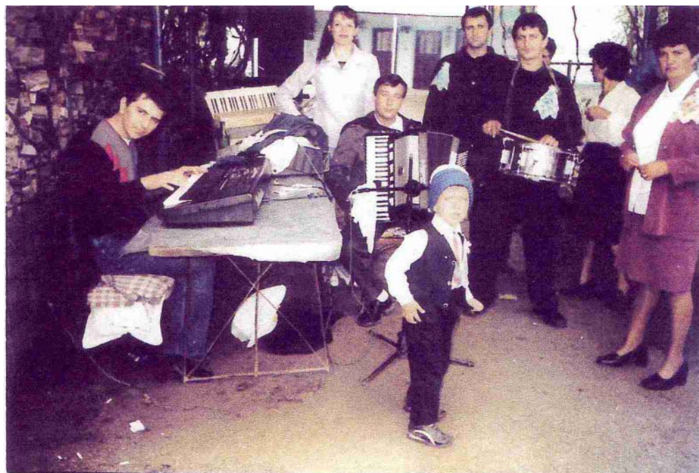
Foto 13. Orchestră modernă din satul Pocruia.