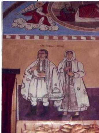
Foto 1. Ctitori ai bisericii cu hramul „Sfinții Voievozi Mihail și Gavril“ din Pocuia, sfințită în anul 1860.

Urzeala se monta pe război, se țesea și se obținea pânza de in mai fină, mai moale și de cânepă mai aspră. Din pânza aceasta se confecționau costumele de vară pentru femei și pentru bărbați.