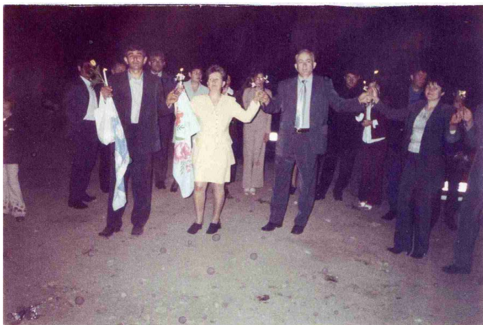
Foto 12. Hore de pomană din ziua de Paști, 2002.