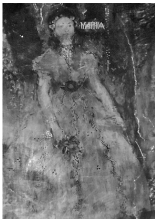
19. Biserica Sf. Gheorghe – Nou, Craiova, Maria, tablou votiv, pronaos, detaliu

Vestimentația Mariei 26 pictorul o reprezintă în întregime în manieră occidentală; o rochie portocalie, cu „râuri” verticale, în zigzag, vegetal-stilizat, pe poale, cu crinolină. Are mâneci scurte și decolteu adânc, în „V”, acoperit cu dantelă albă. Talia foarte subțire este marcată de paftale de formă circulară, cu un decor concentric stilizat. Părul, prins la spate, într-un coc format pe ceafă, este împodobit, pe frunte cu o diademă de flori albe. La ambele mâini poartă brățări și în dreapta ține un buchet de flori galbene.