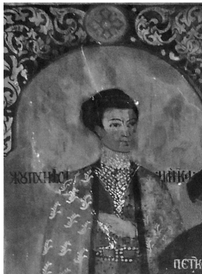
18. Biserica Sf. Gheorghe – Nou, Craiova, Jupânița Ilinca, tablou votiv, detaliu

Elena, copilă, poartă o diademă de bani mici și flori prinse în părul brunet, pieptănat cu cărare pe mijloc și lăsat liber pe spate. Poartă cercei, probabil tot din bani mici, în formă de „ciorchine”; la gât, salbă, în maniera celor grecești numite skaletta 24 iar talia îi este marcată de o pereche de paftale circulare, bordate în filigran, cu un decor în formă de rozetă, punctată