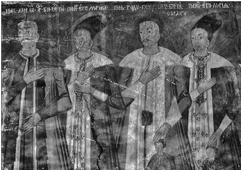
2. Biserica Sf. Voievozi, com. Braloștița, jud. Dolj, Panițele Marica și Maria, pronaos, latura N, detaliu

anterior cu gulerul, lateralele fețelor și manșetele înalte, din blană albă; părul, cu cărare pe mijloc și prins în coc la spate, este acoperit cu căciuli înalte.