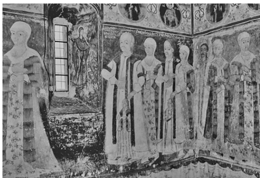
11, 12 și 13. Biserica Intrarea în Biserică a Maicii Domnului și Sf. Ioan , com. Urșani, jud. Vâlcea, pronaos, detalii