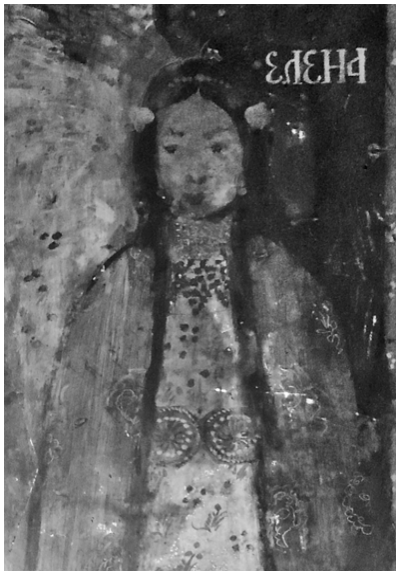
17. Biserica Sf. Gheorghe – Nou, Craiova, Elena, tablou votiv, detaliu

central de câte un caboșon verde, iar pe contur de câte 17 și, respectiv, 13 caboșoane albe, prinse peste rochia de culoare alb-gălbui cu motive florale roșii și verzi. Pe umeri poartă un antieriu verde, cu motive vegetal-stilizate albe, bordat cu blană neagră.