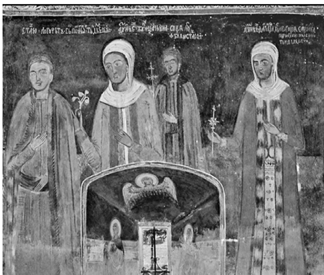
14. Biserica Ioachim și Ana , com. Logrești, jud. Gorj, pronaos, detaliu