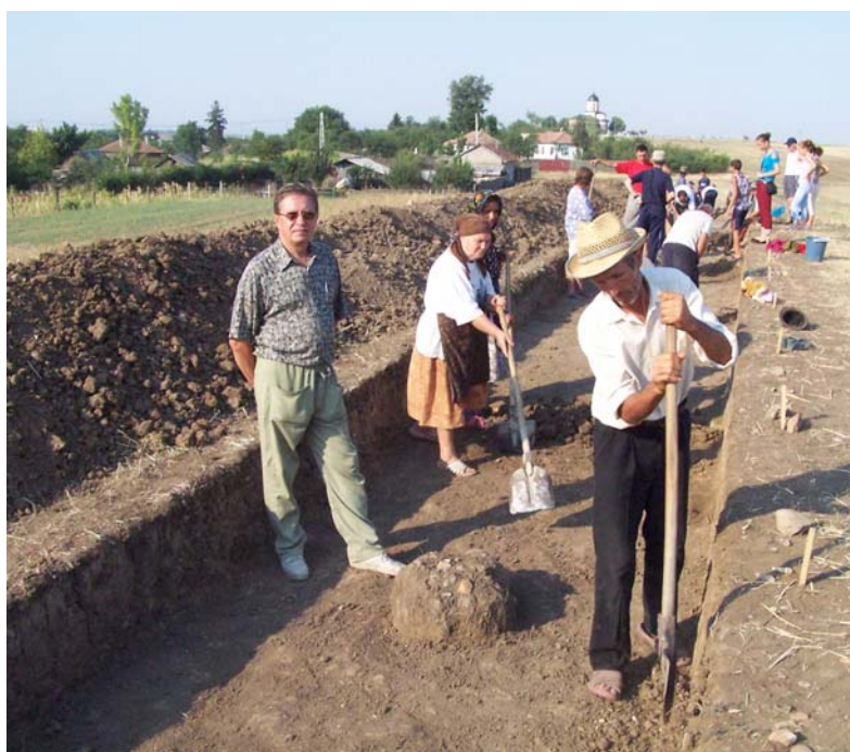
2007. Romula, Comuna Dobrosloveni, județul Olt, studenți (în plan secund) și muncitori în timpul cercetărilor arheologice efectuate în cel mai mare oraș de epocă romană din Oltenia.