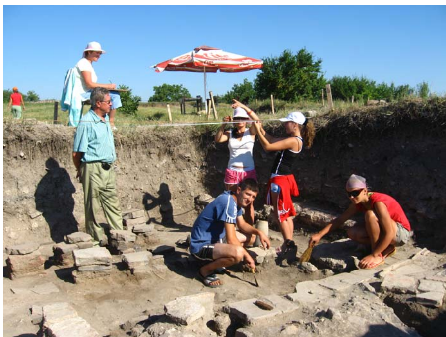
2008. Studenți efectuând măsurători în hypocaustul descoperit în clădirea centrală din cetate.