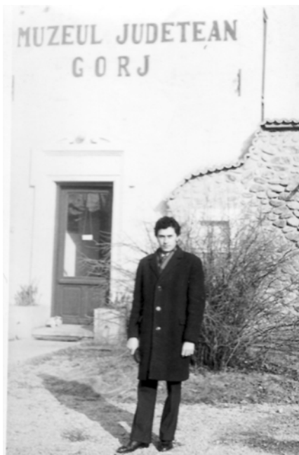
1974 Muzeograf la Muzeul Județean Gorj, Tg-Jiu, strada Tudor Vladimirescu, nr. 75.