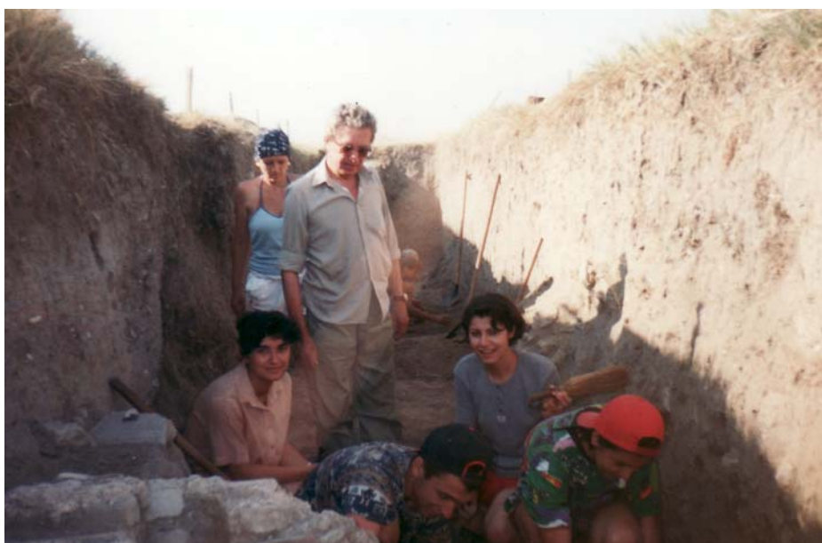
2000. Sucidava – Corabia, județul Olt. Aspecte de pe șantierul arheologic unde studenții de la Istorie efectuează practica arheologică sub îndrumarea profesorului Petre Gherghe.