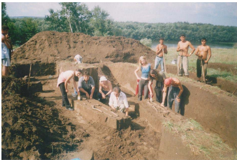
2016. Grup de studenți la intrarea în incinta cetății romano-bizantine.