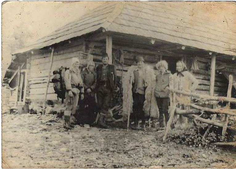
La stâna din Bulzu

În muntele Bulzu, aproape de cele trei biserici, am fost și eu înainte de a scrie lucrarea despre ungurenii din satele Bratilov și Titerlești. Îmi amintesc poteca adâncită, parcă cicatrizată în carnea muntelui, de urmele atâtor animale care au străbătut-o, căci pe acolo treceau atât „potecile oii”,cât și „potecile sării” prin care se făcea legătura cu frătuții .