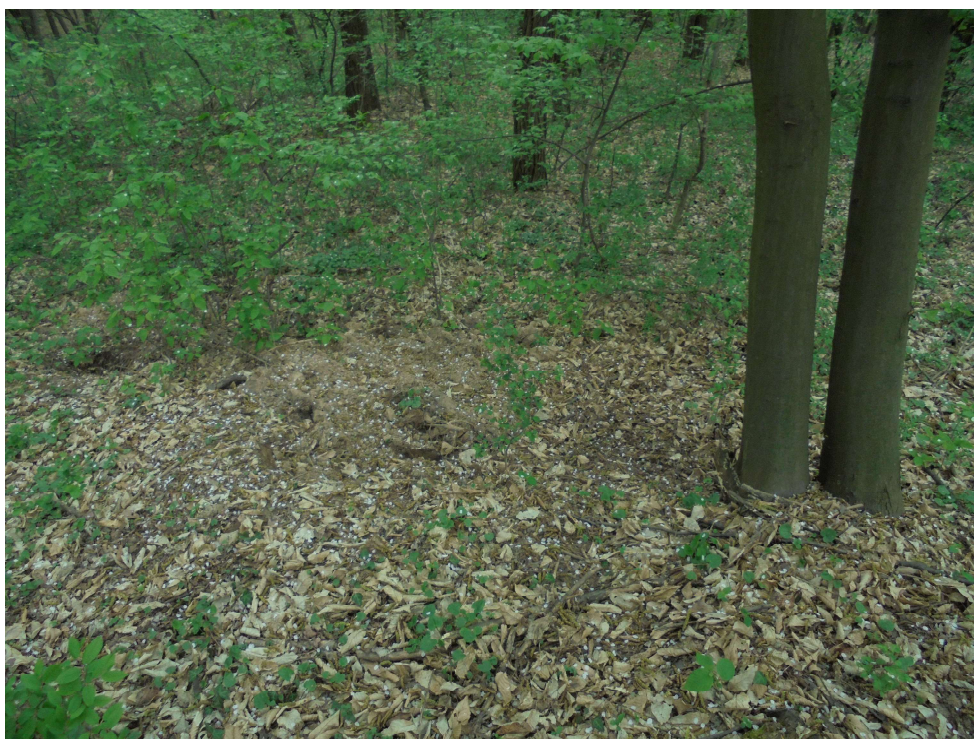
Locul descoperirii tezaurului roman imperial de la Cârbești –Drăguțești, punctul "Coasta Cocoanei,,