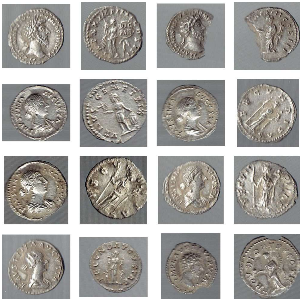
Planșa 6. Monede catalog nr. 41 – 48.