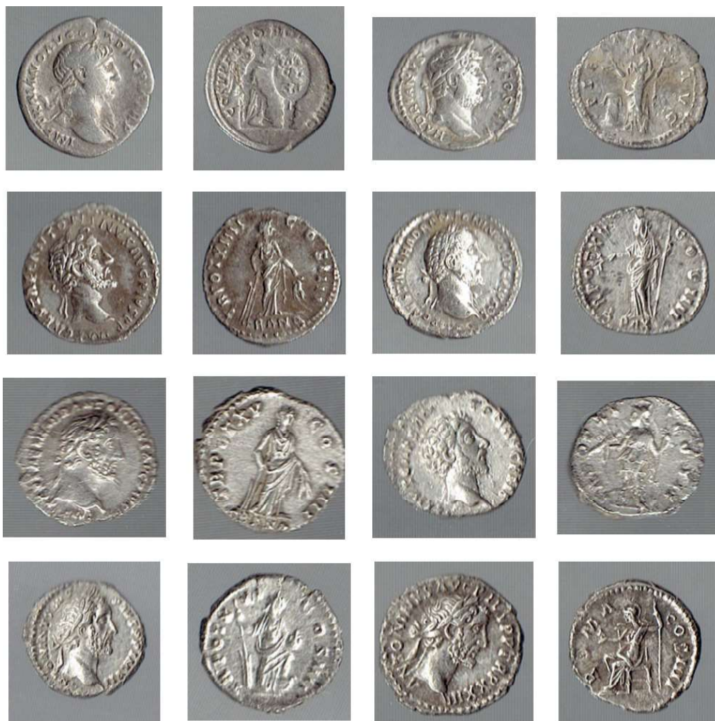
Planşa 2 . Monede catalog nr. 9 – 16.