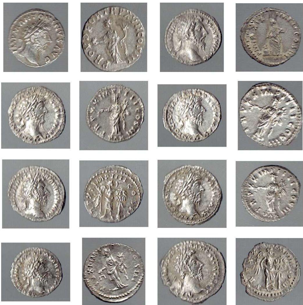
Planșa 5 . Monede catalog nr. 33 – 40.