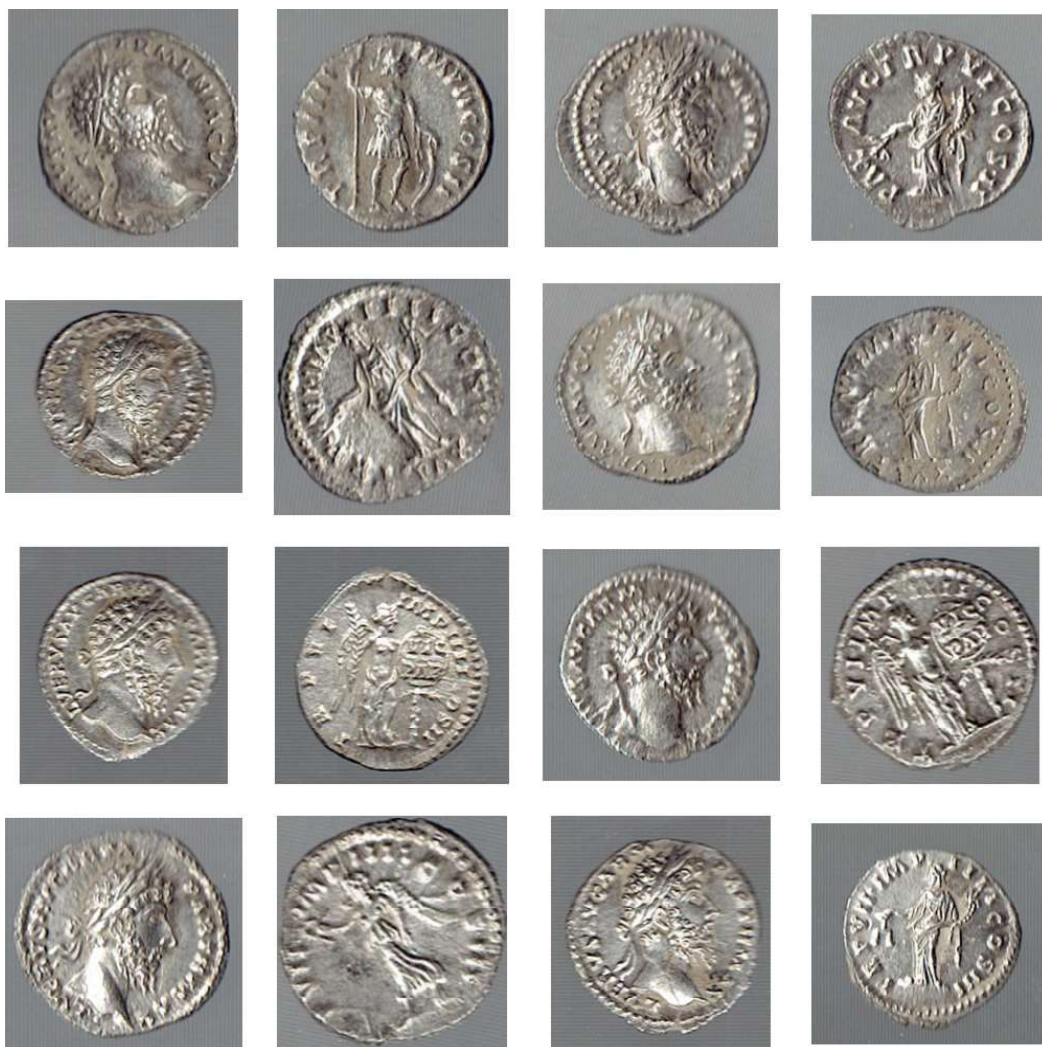
Planşa 7. Catalog monede nr. 49 – 56 .