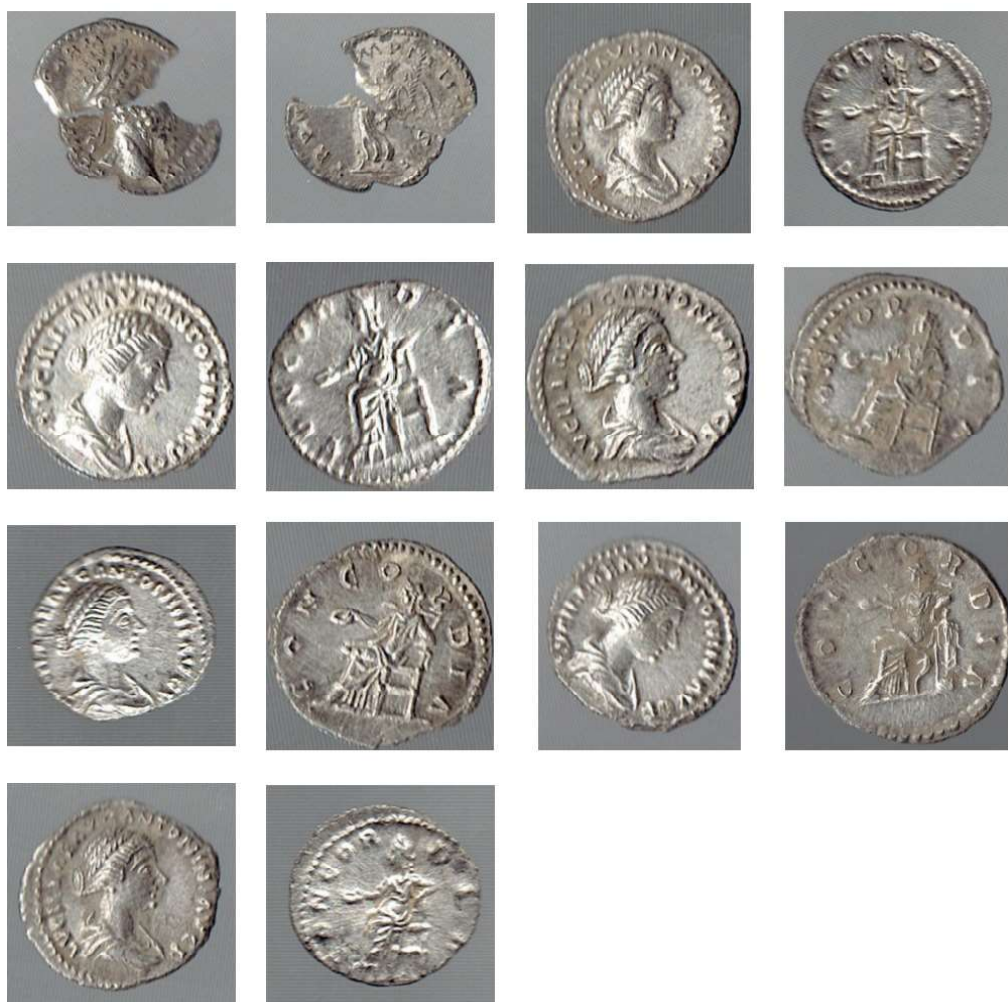
Planșa 8 . Catalog monede nr. 57 – 63