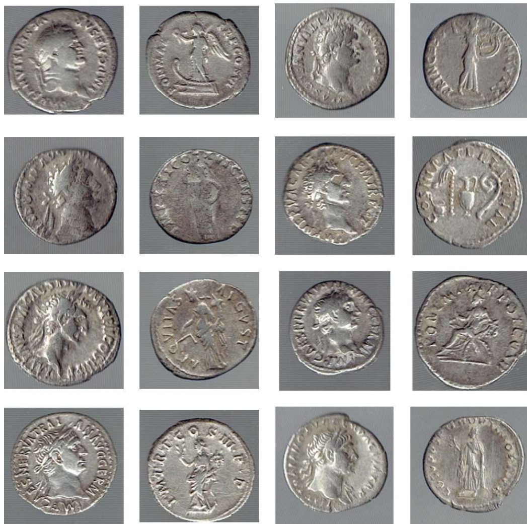
Planşa 1. Monede catalog nr. 1 – 8.