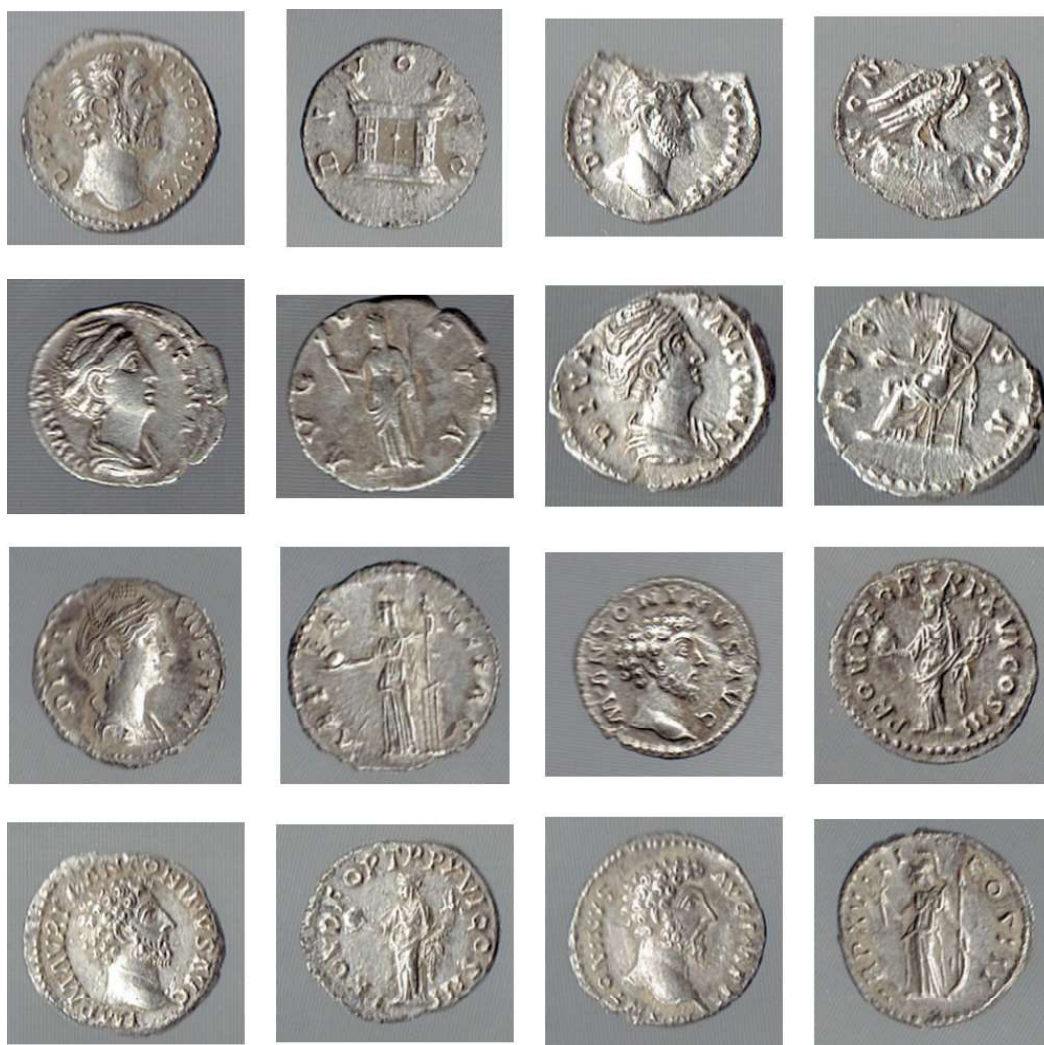
Planșa 4. Monede catalog nr. 25 – 32.