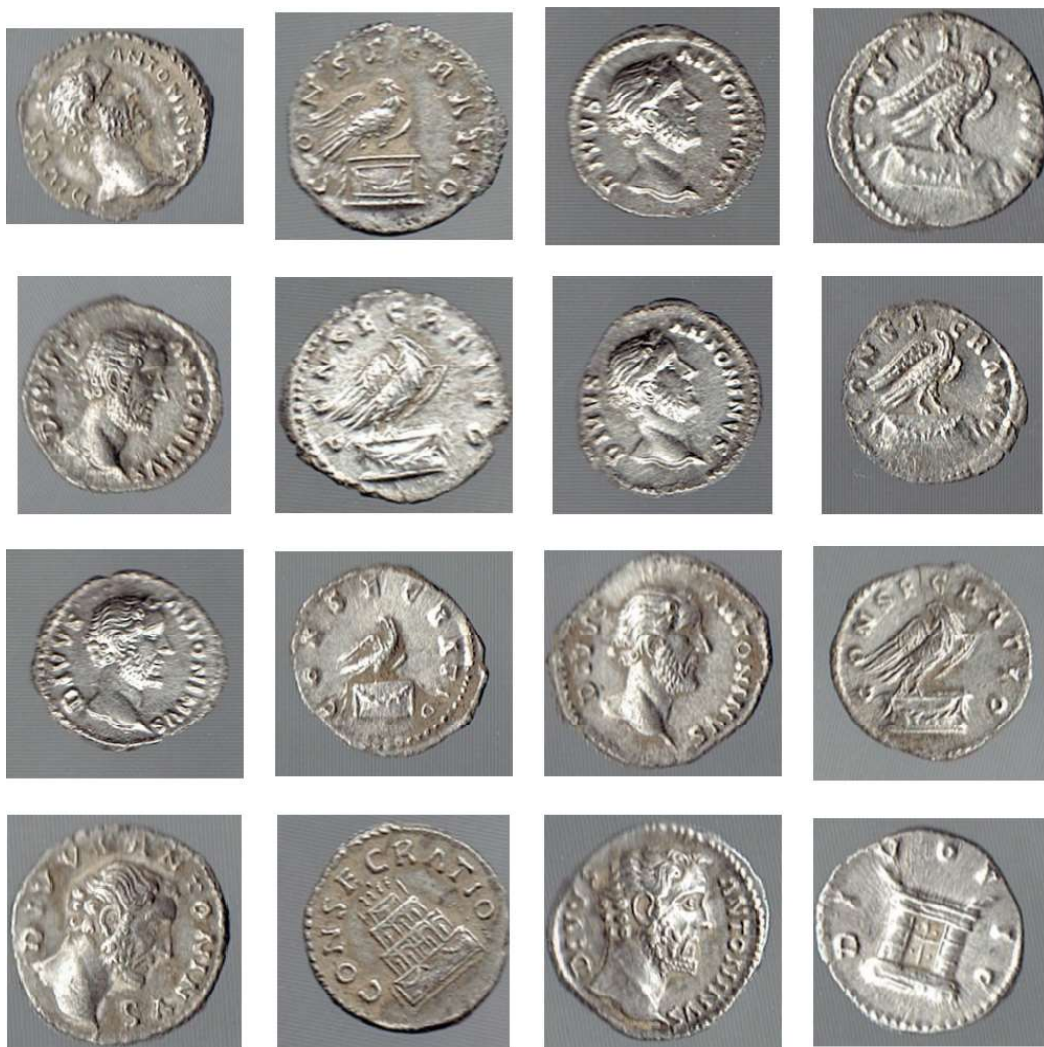
Planşa 3. Monede catalog nr. 17 – 24.