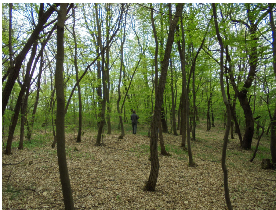
Locul descoperirii tezaurului roman imperial de la Cârbești –Drăguțești, punctul "Coasta Cocoanei,,