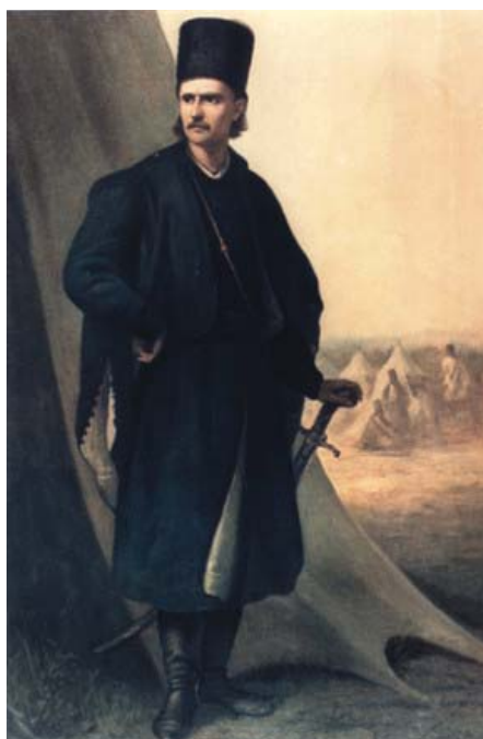
Fig. 1 Portretul lui Tudor Vladimirescu realizat de către pictorul craiovean Theodor Aman. O reproducere a acestui portret este expusă în cadrul expoziției permanente a Secției de Arheologie-Istorie a Muzeului Județean Gorj „Alexandru Ștefulescu” din Târgu-Jiu.