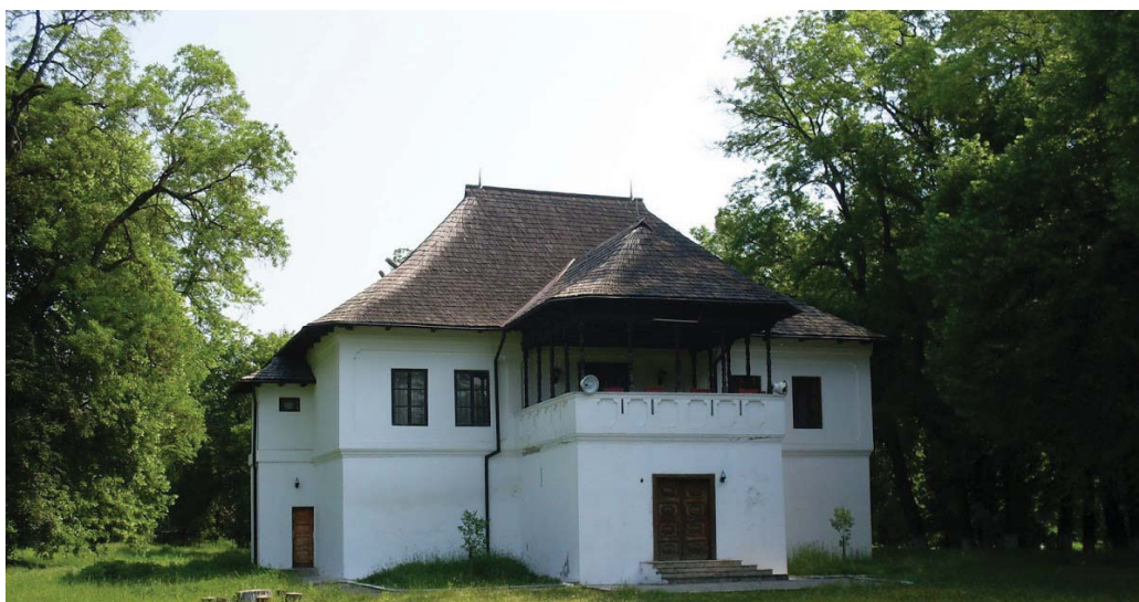
Fig. 10 Cula Glogoveanu de la Glogova.