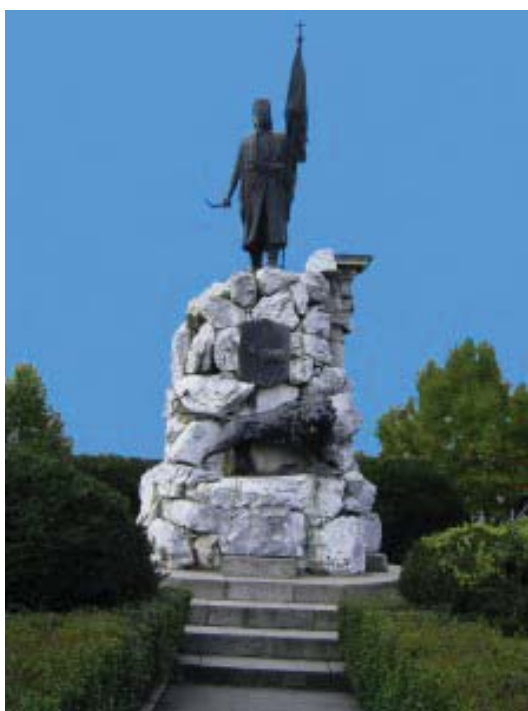
Fig. 6 Statuia lui Tudor Vladimirescu, realizată de către sculptorul gorjean Constantin Bălăcescu, amplasată în centrul oraşului Târgu-Jiu în 1898.