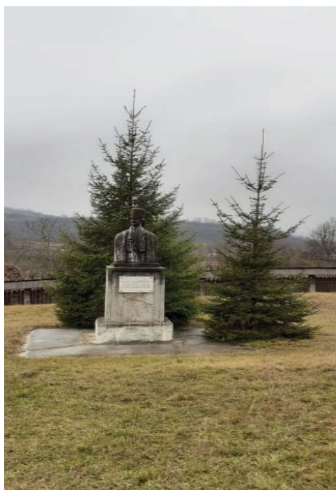
Fig. 5 Bustul lui Tudor Vladimirescu amplasat în curtea casei memoriale de la Vladimir, realizat de către sculptorul gorjean Vasile Blendea.