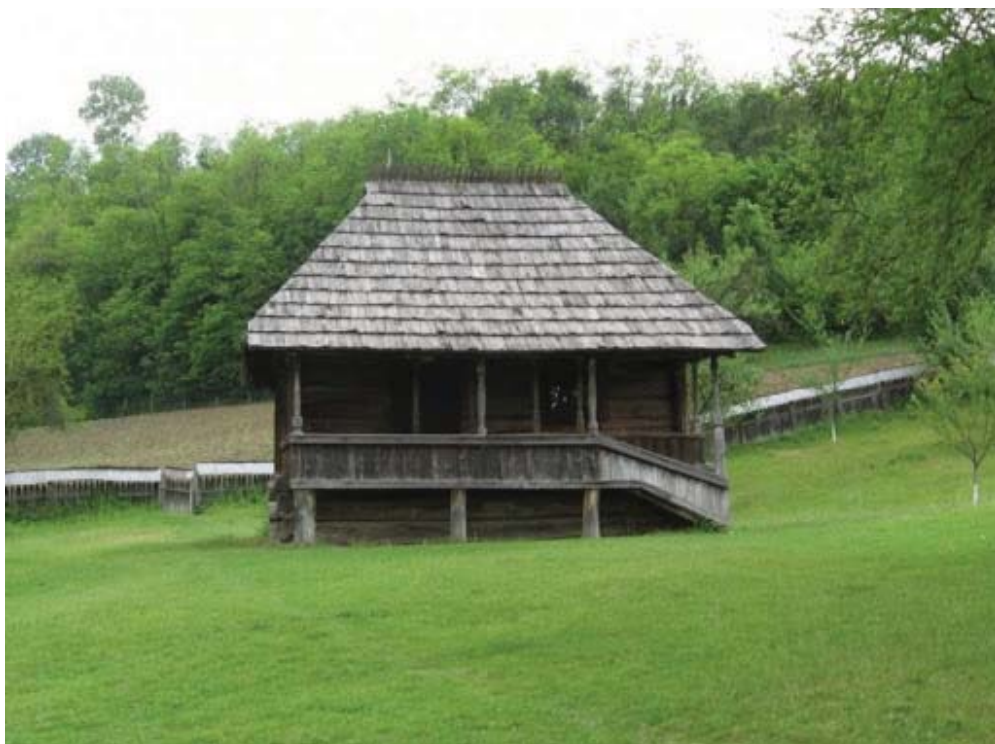
Fig. 4 Casa memorială „Tudor Vladimirescu” din comuna Vladimir.