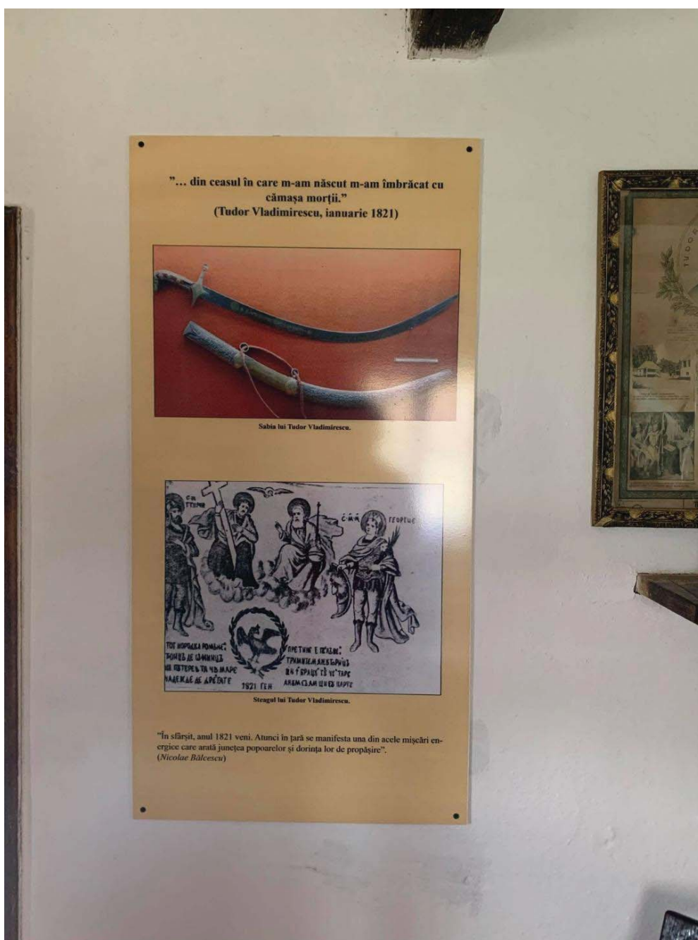
Fig. 15 Aspect din cadrul expoziției permanente a casei memoriale „Tudor Vladimirescu” din comuna Vladimir.