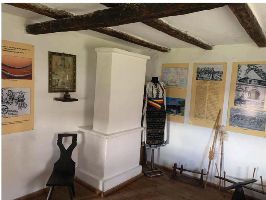
Fig. 12 Interiorul uneia dintre cele două camere ale casei memoriale „Tudor Vladimirescu” din Vladimir.