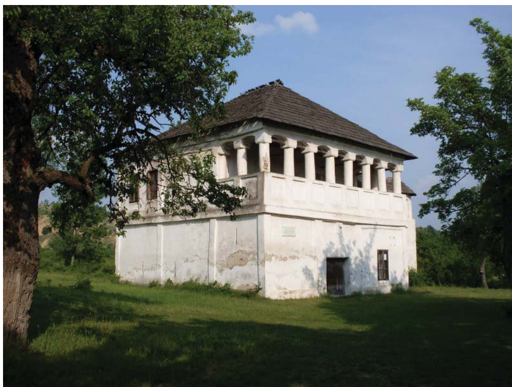
Fig. 11 Cula lui Tudor Vladimirescu de la Cerneți, jud. Mehedinți.