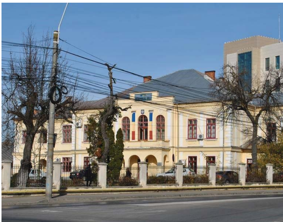
Fig. 7 Casa deținută de familia Glogoveanu în Craiova, actualmente sediu al Tribunalului Dolj.