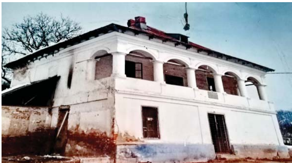
8. Casa căpitanului Dumitru Gârbea din Vladimir (sf. sec. XVIII).