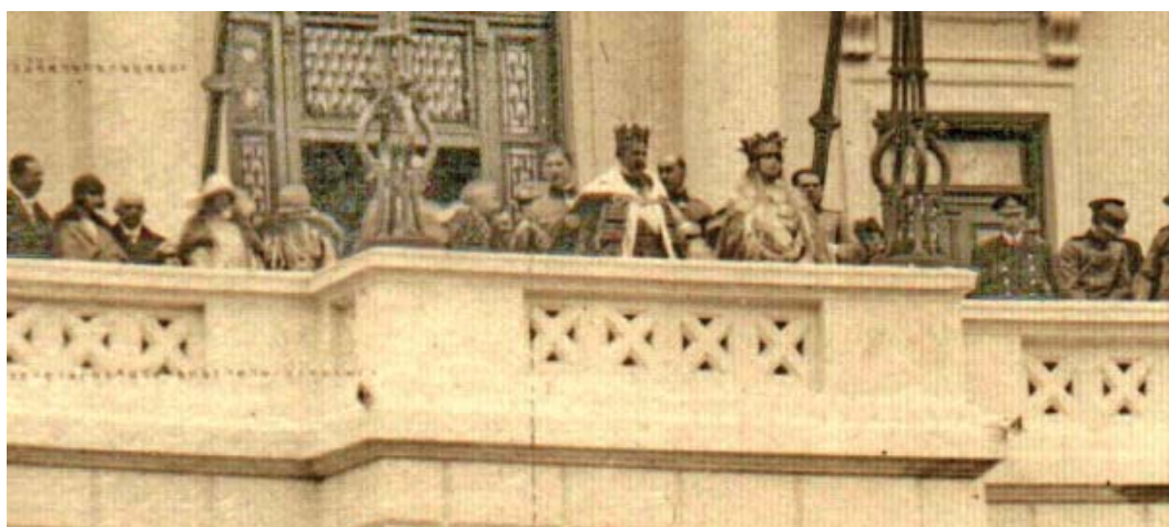
2 . Regele Ferdinand I și regina Maria omagiindu-l pe Tudor Vladimirescu din balconul Academiei Române, în mai 1921