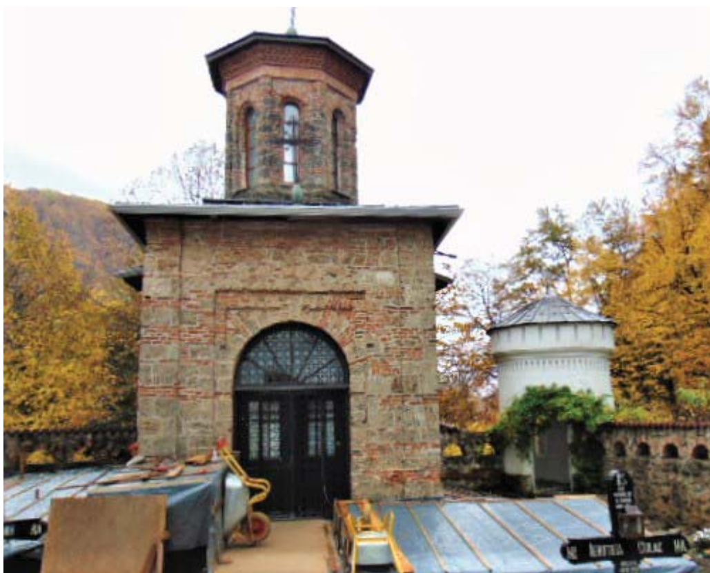
3 . Biserica paraclis a mănăstirii Tismana cu hramul "Sf. Ilie Tesviteanul,, ctitorie a lui Matei Basarab din 1651.