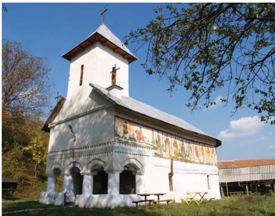
9. Biserica "Sf. Împărați Constantin și Elena, Sf. Ioan Botezătorul și Sf. Paraschiva,, din satul Vladimir, construită în 1835 și pictată în 1844.