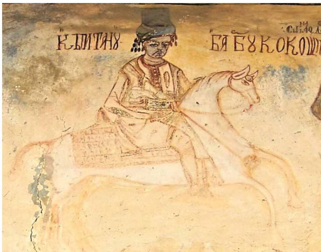
13. Căpitanul de panduri Barbu Cocos din Groșerea (pictură murală în frescă, de pe fațada de sud a bisericii, realizată după 1822 .