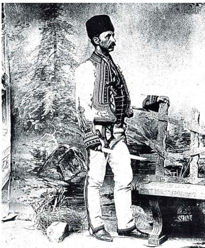
7. Fotografia lui Constantin Vladimirescu (1858 – 1922), fiul lui Ioan Vladimirescu .