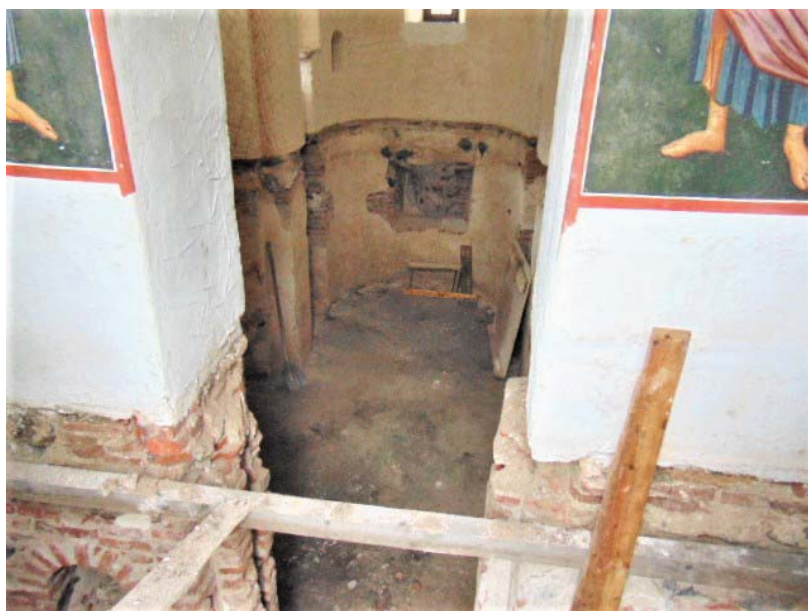
4. Ascunzătoarea de sub podeaua bisericii paraclysis.