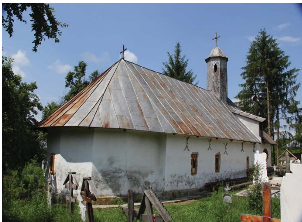
16. Biserica „Duminica Tuturor Sfinților”, sat Călugăreasa, comuna Prigoria (1821 – 1822).