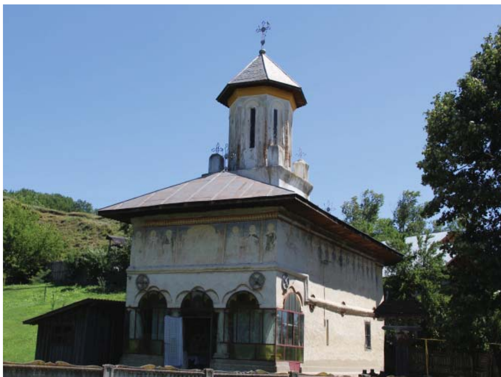
11. Biserica " Sfinții Voievozi,, din satul Groșerea, comuna Aninoasa, județul Gorj – construită și pictată în interior în 1808, iar în exterior, după 1822..