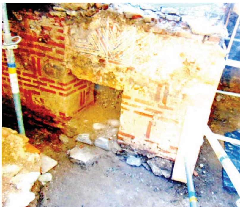
5. Intrarea în ascunzătoare (lateral vest, având dimensiunile de 90 x 80 cm)