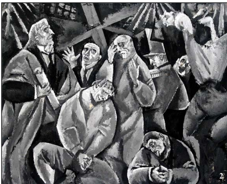
Lucrări de Lascăr Vorel: 1. Vedere din atelier (ulei/pânză); 2. Posedații (guașă/carton)