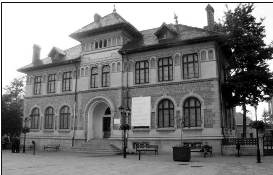
Muzeul de Artă Piatra-Neamț