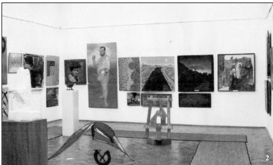
Lucrări expuse la Bienala „Lascăr Vorel”: 1. în 1999; 2. în 2009