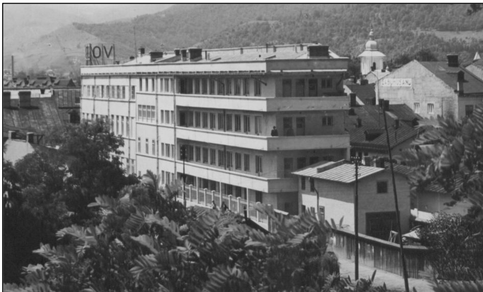
Clădirea Farmaciei și a Laboratoarelor Vorel, 1930