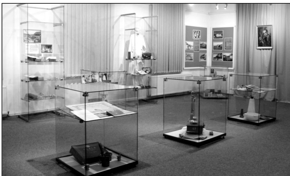
Imagini generale cu expoziția