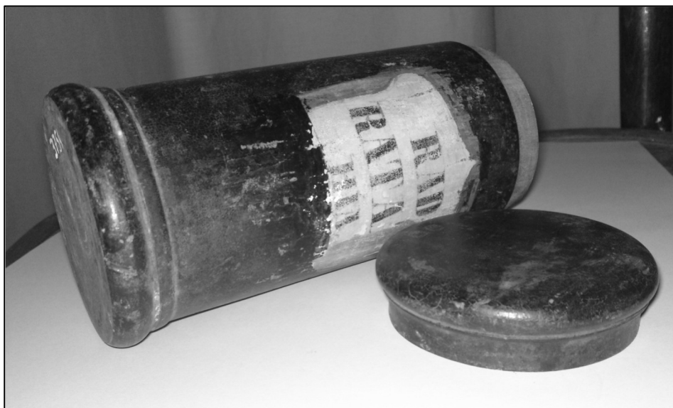
Recipient farmaceutic, sec. XVIII