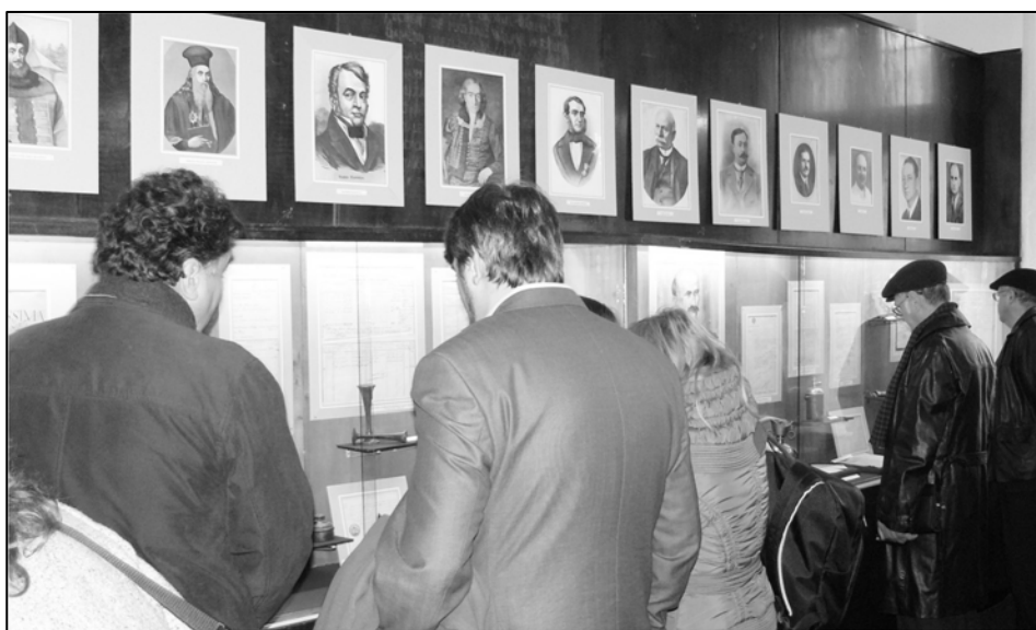
Vizitatori în expoziție