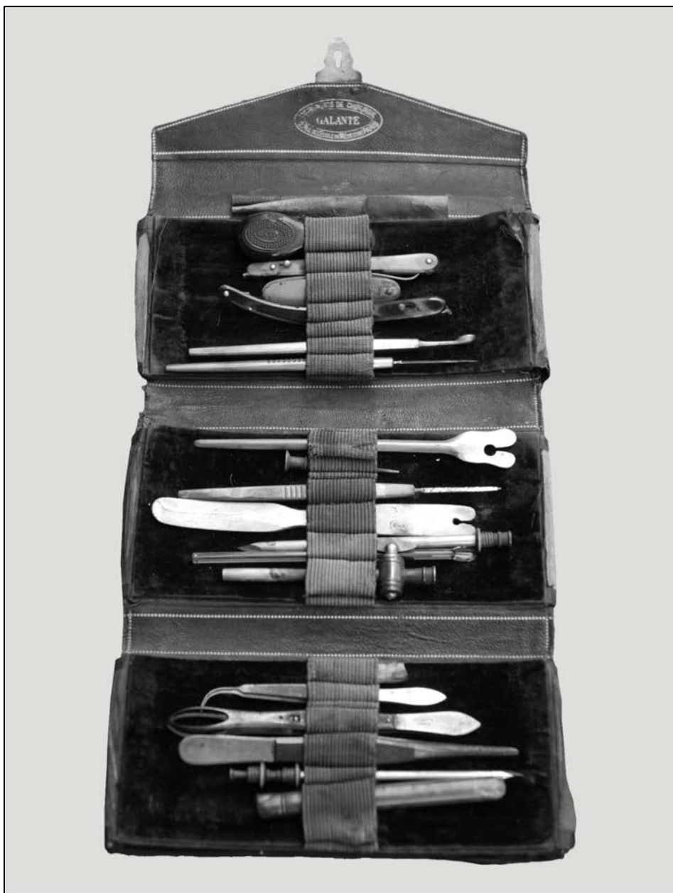
Trusă de mică chirurgie, folosită în Războiul de Independență