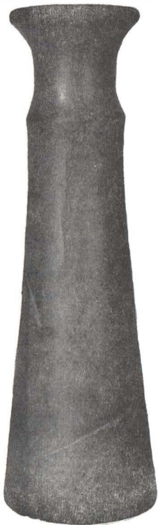
Fig. 1. — Sceptrul de piatră descoperit la Voinești. http://www.muzeu-neamt.ro / http://cimec.ro