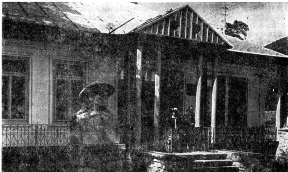
Fig. 1. — Muzeul memorial „Calistrat Hogaș“ (aspect exterior).

În anii orînduirii populare casa a devenit muzeu memorial, iar din 1956 a fost luată în grija Sfatului popular orășenesc Piatra Neamț. Amenajarea muzeistică rămăsese aceeași.