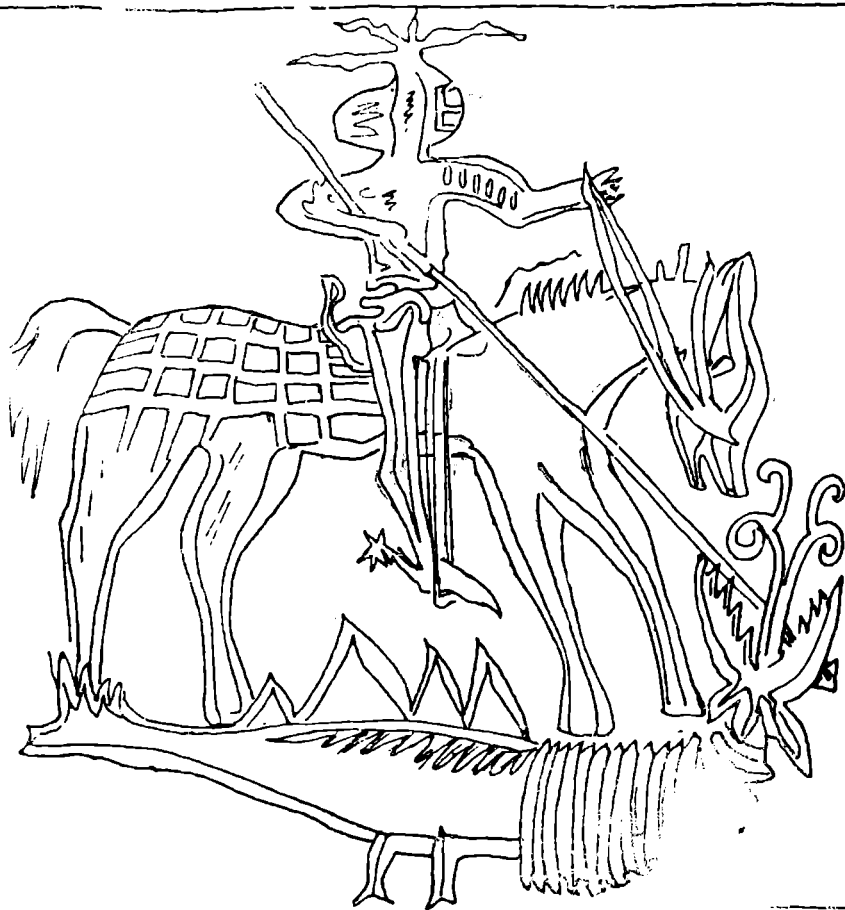
Fig. 2. — Vaslui, Curțile domnești. Cahlă din prima jumătate a secolului al XV-lea cu imaginea sf. Gheorghe (reconstituire).