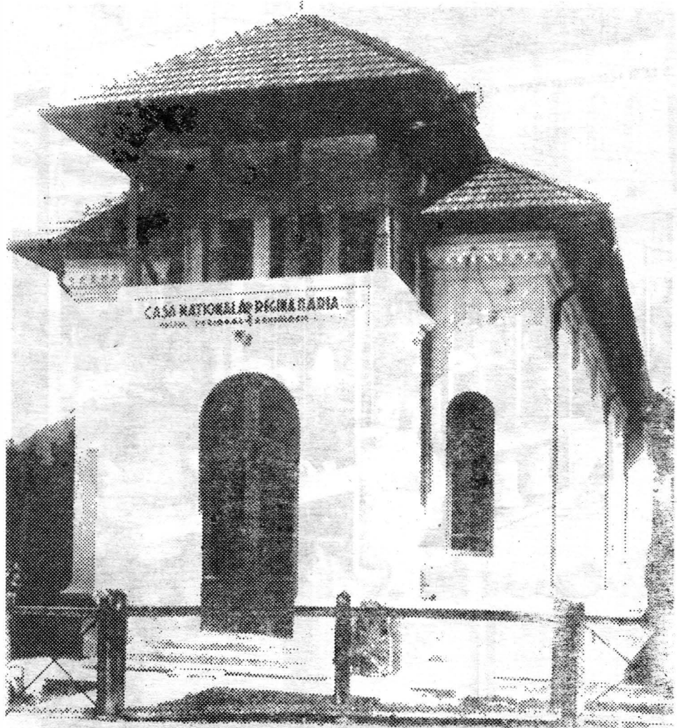
Fig. 1 Prima clădire în care a funcționat Muzeul de istorie Piatra Neamț.