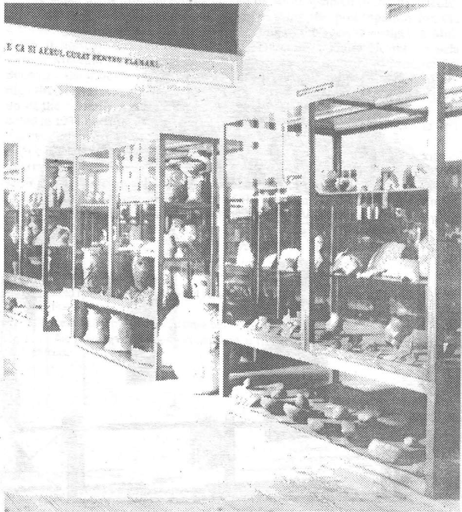
Fig. 2 Imagine din expoziția existentă la Casa Națională "Regina Maria".