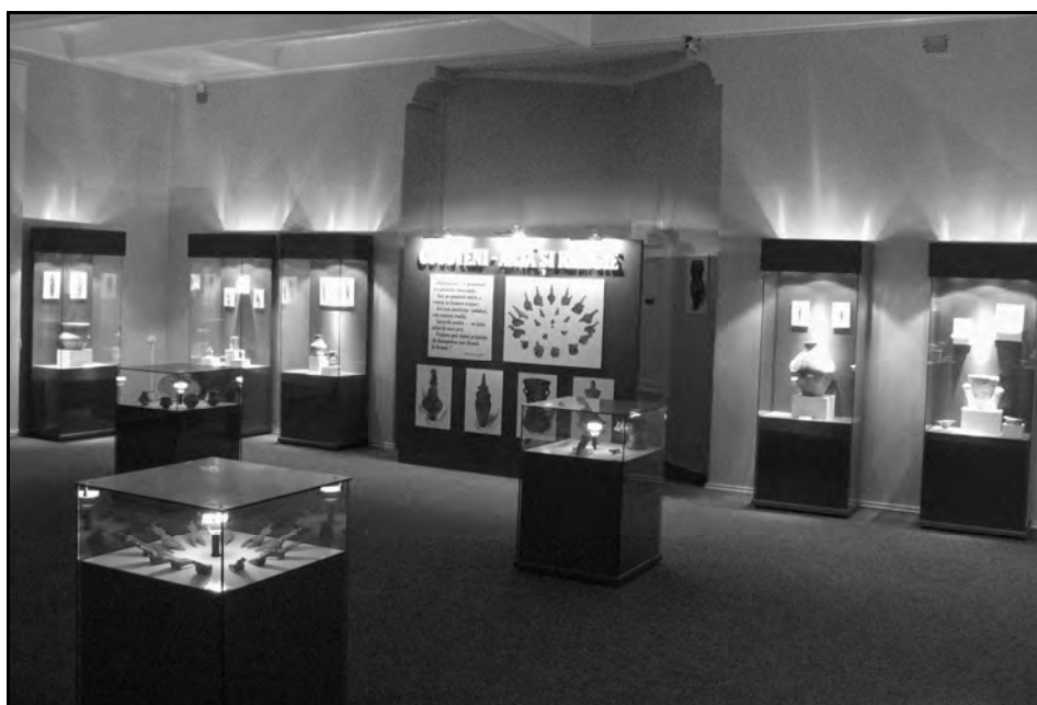
Imagini din sălile de expoziție.

http://www.muzeu-neamt.ro / http://cimec.ro