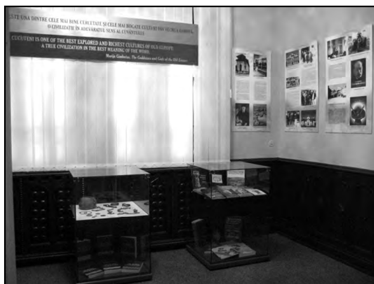
Imagini din expoziție.

http://www.muzeu-neamt.ro / http://cimec.ro