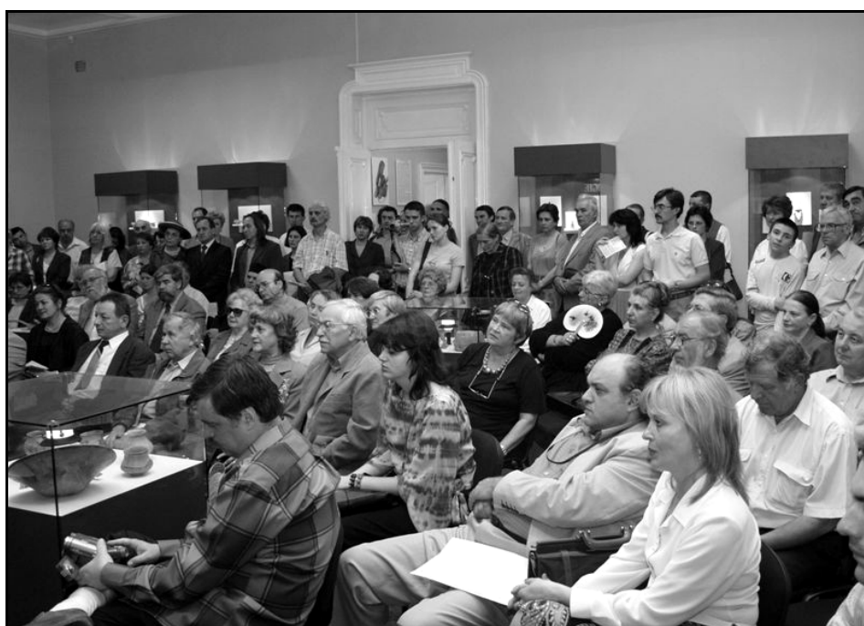
Aspecte de la vernisaj.

http://www.muzeu-neamt.ro / http://cimec.ro