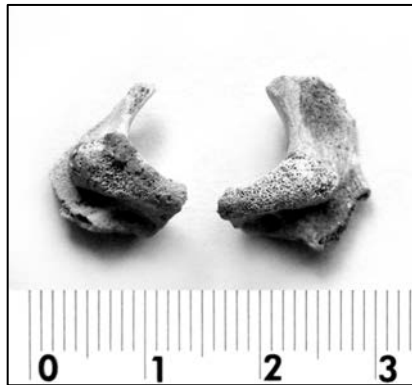
Fig. 2. Fragmente de occipital: masele laterale cu condili occipitali.