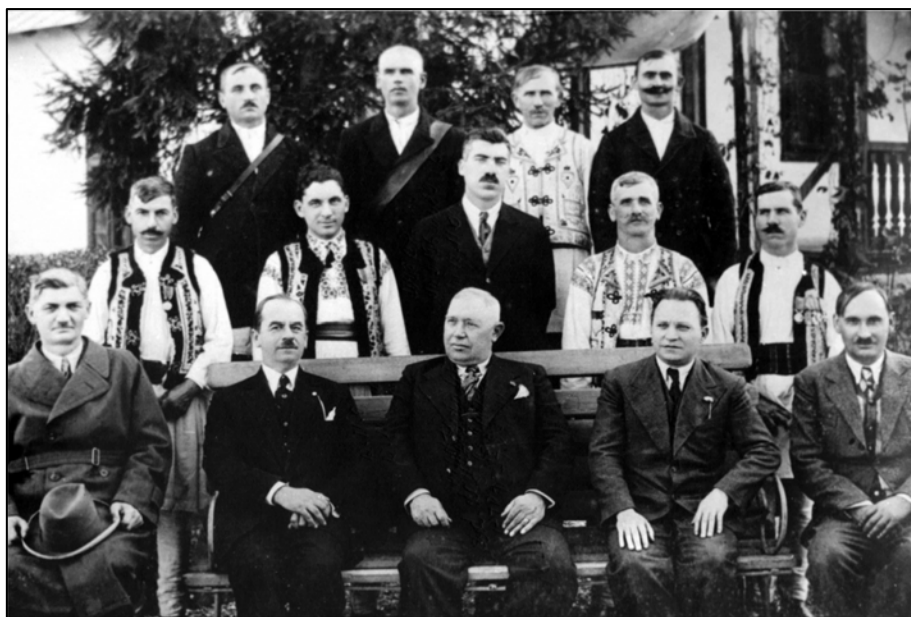
Fig. 10. Personalul Domeniului Coroanei, 1938