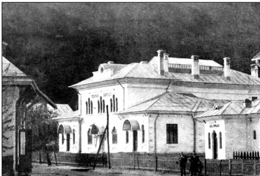
Fig. 5. Baia Populară și Teatrul din Bicz, Domeniul Coroanei