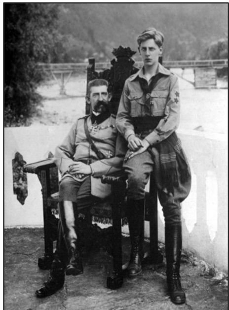
Fig. 7. Imagini ale familiei regale la Bicz, în 1918