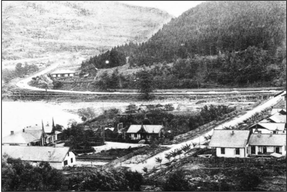
Fig. 2. Imagine de ansamblu de pe Domeniul Coroanei Bicaz