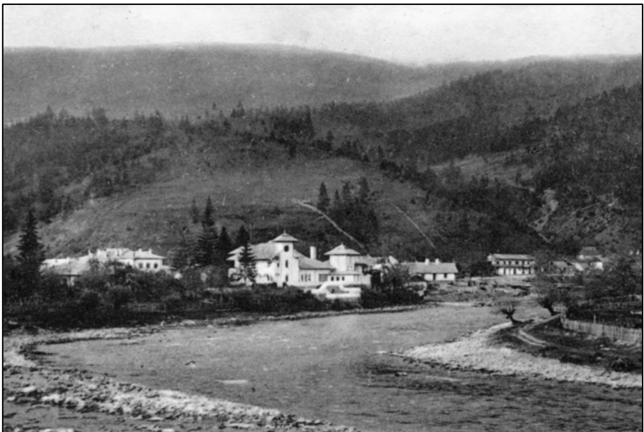
Fig. 3. Valea Bistriței. În fundal se observă reședința familiei regale de la Bicaz