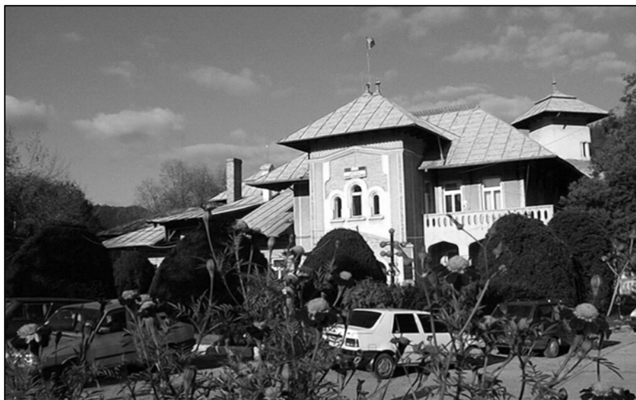
Fig. 4. Fosta reședință regală, actualul sediu al primăriei orașului Bicaz