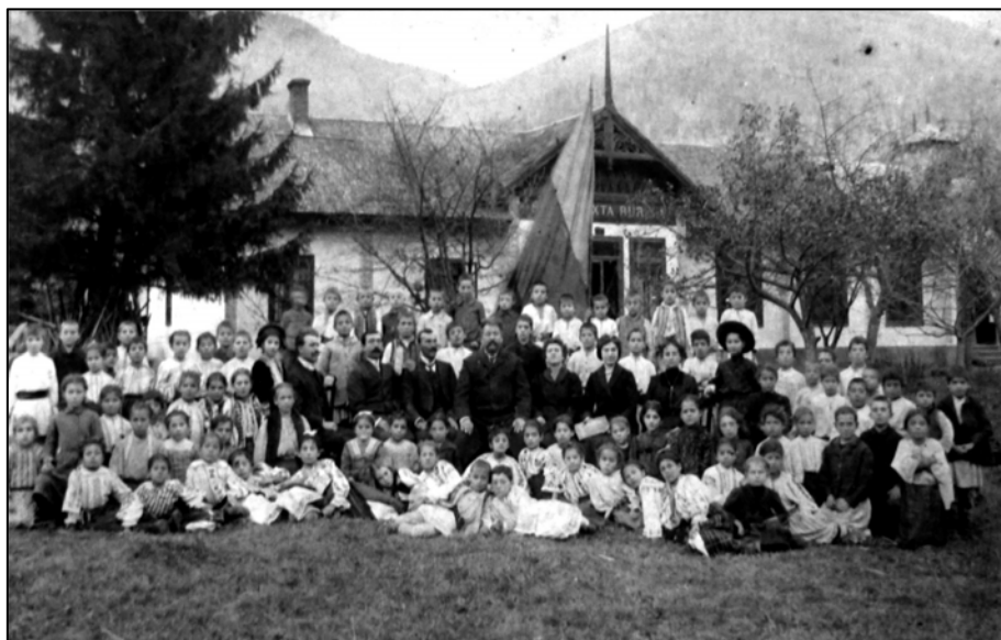
Fig. 6. Școala primară rurală mixtă de pe Domeniul Coroanei, Bicz