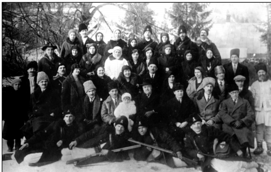
Fig. 9. Personalul Domeniului de la Biczaz, 1932