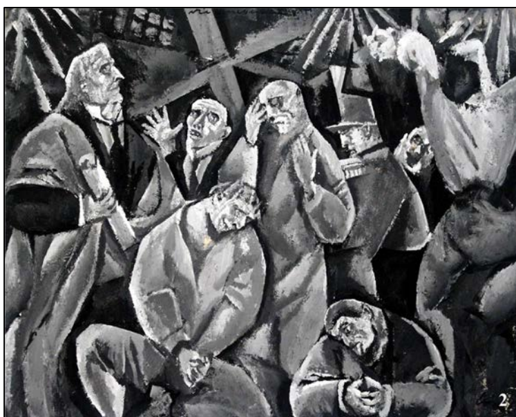
Lucrări de Lascăr Vorel: 1. Vedere din atelier (ulei/pânză); 2. Posedații (guașă/carton)