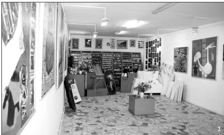
Galeria „Lascăr Vorel”, extinsă și modernizată