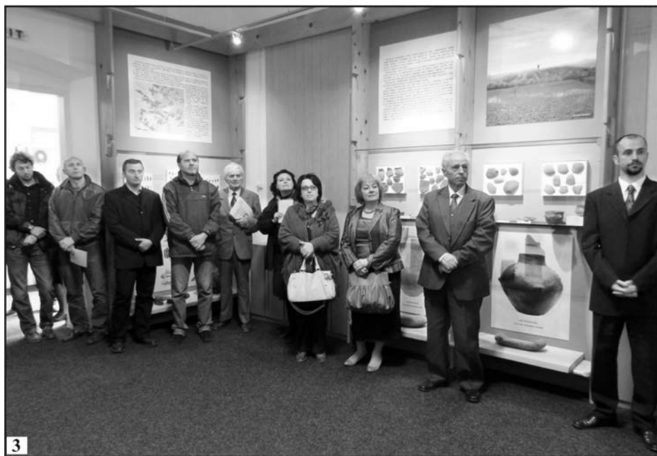
Fig. 3. 1. Afișul manifestării; 2-3. Imagini din timpul festivității de deschidere