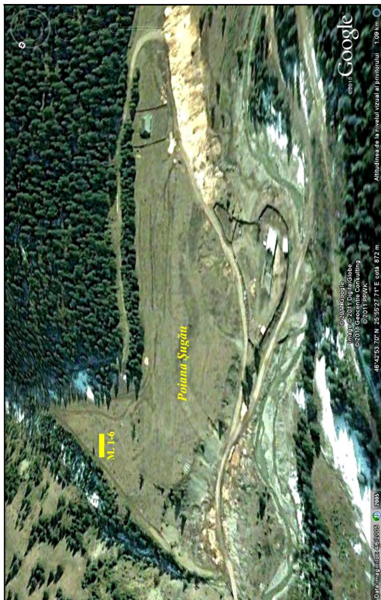
Fig. 2. Poiana Șugău cu zona în care se aflau cele șase morminte (M. 1-6)