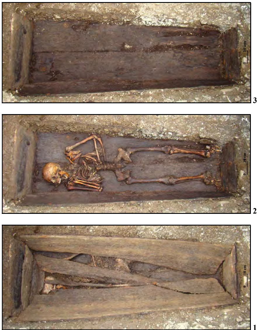
Fig. 6. Huisurez-Poiana Șugău. Mormântul 3 (M.3) – imagini de ansamblu asupra sicriului (1), scheletului (2) și gropii (3) (1-3 – foto C. Preoteasa)