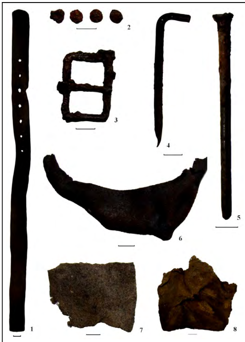
Fig. 11. Huisurez-Poiana Șugău. Inventar: 1 – curea (M.5); 2 – nituri (M.5); 3 – cataramă (M.3); 4, 5 – cuie (M.6); 6 – cozoroc de șapcă (M.1); 7, 8 – resturi de uniformă militară (M.4) (1-8 – foto C. Preoteasa)