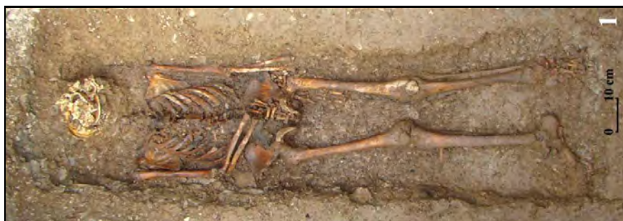
Fig. 5. Huisurez-Poiana Șugău.

Mormântul 1 (M.1) – imagine de ansamblu asupra scheletului