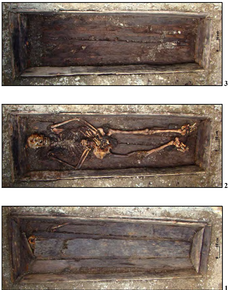
Fig. 7. Huisurez-Poiana Șugău. Mormântul 4 (M.4) – imagini de ansamblu asupra sicriului (1), scheletului (2) și gropii (3) (1-3 – foto C. Preoteasa)