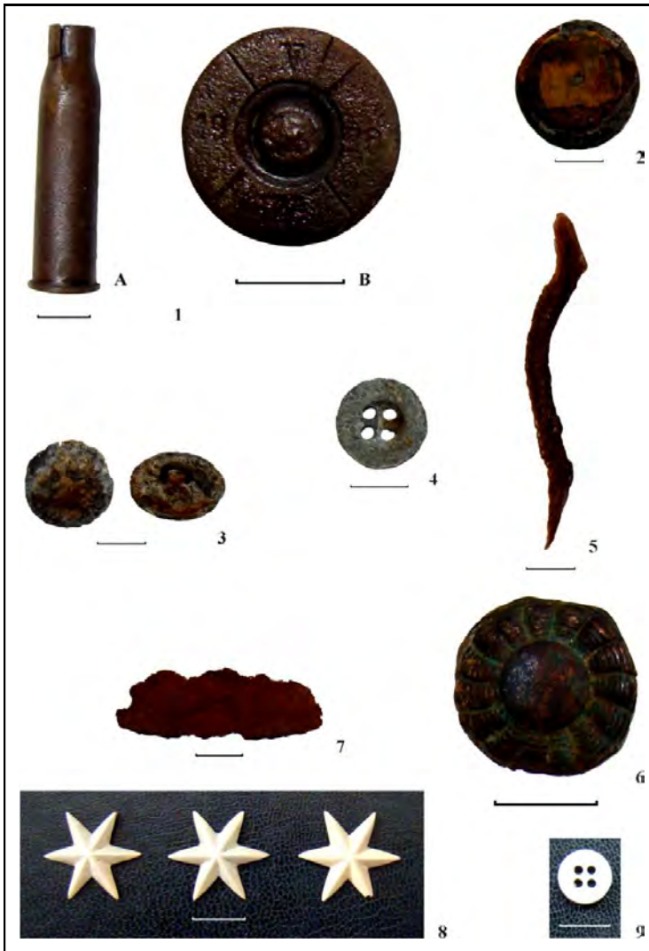
Fig. 10. Huisurez-Poiana Șugău. Inventar: