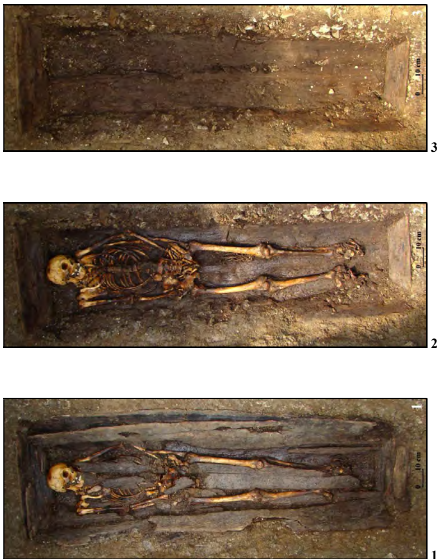
Fig. 9. Huisurez-Poiana Șugău. Mormântul 6 (M.6) – imagini de ansamblu asupra sicriului (1), scheletului (2) și gropii (3) (1-3 – foto C. Preoteasa)