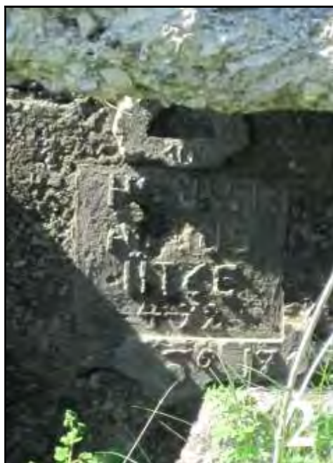
Fig. 3. Cazemată din Masivul Șugău – vedere de ansamblu (1) și detaliu inscripție (2)