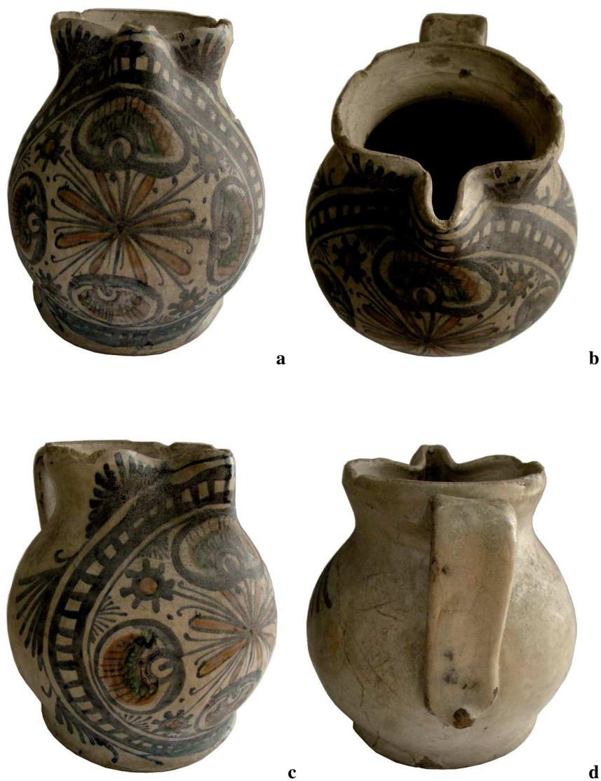
Pl. I. Aspecte ale cării maiolice cu angobă bej, decor floral și geometric (albastru-cobalt, roz, verde) în medalionul cu motivul „scării” (sec. XVI-XVII) (a-d).