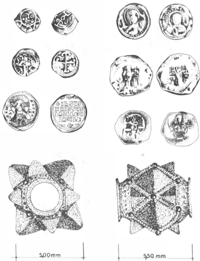
Fig. 2. Monede descoperite la Panchu și cap de buzdugan provenind din satul Salcia-Veche, com. Clorăști, jud. Vrancea