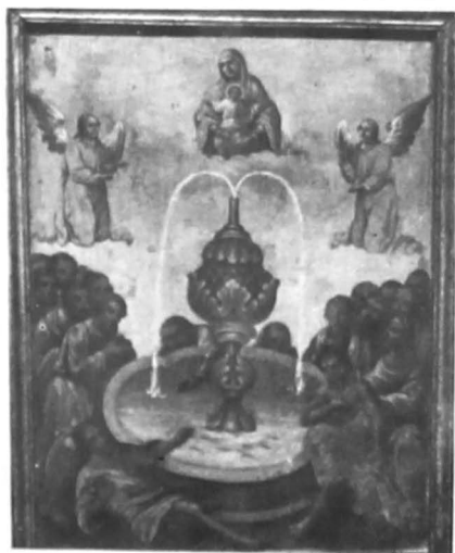
Fig. 1. ICOANĂ CU DOUĂ FEȚE a) Învierea lui Iazăr. b) Fântâna tămăduirii; 2/2 XIX, 34 × 26,5 cm. Ulei/lemn. Mănăstirea Ciolanu