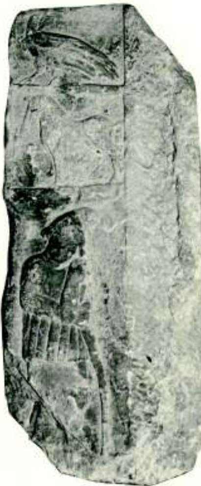
Fig. 8. Perete lateral stâng de

Piesa, sculptată dintr-un calcar mai dur, reprezintă fără îndoială peretele lateral stâng al unei aedicula , împărțit, prin chenare profilate orizontale, în trei registre. În cel superior este reprezentat un păun cu capul întors spre spate, ținând în plisc un șarpe lăsat în jos, cu coada încolăcindu-se în jurul piciorului său drept. În registrul mijlociu apare un cal în mers liniștit, mișcându-se spre stânga, iar în cel inferior este reprezentat Attis în poziția obișnuită, jumătate întors spre dreapta, rezezat cu mâna dreaptă și cu cotul mâinii stângi în bastonul de păstor ( pedum ). Pe cap poartă nelipsita bonetă frigiană, este înveșmântat într-o tunica mai lungă, peste care este pusă alta mai scurtă, cu mâneci lungi, tunica manicata , încinsă la mijloc și prevăzută de la brâu