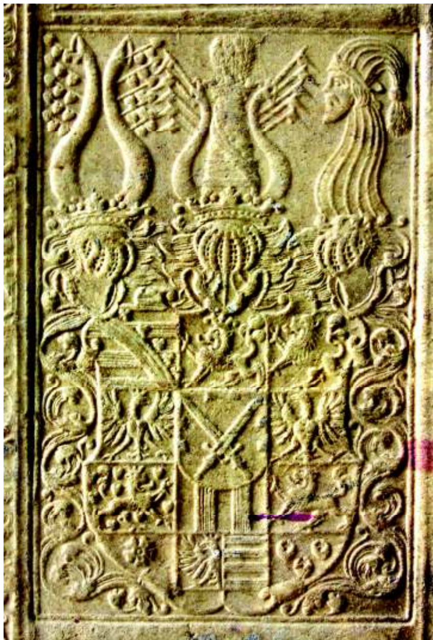
Fig. 12. Stema Saxoniei (vol. IV, coperta 2 sus, detaliu).