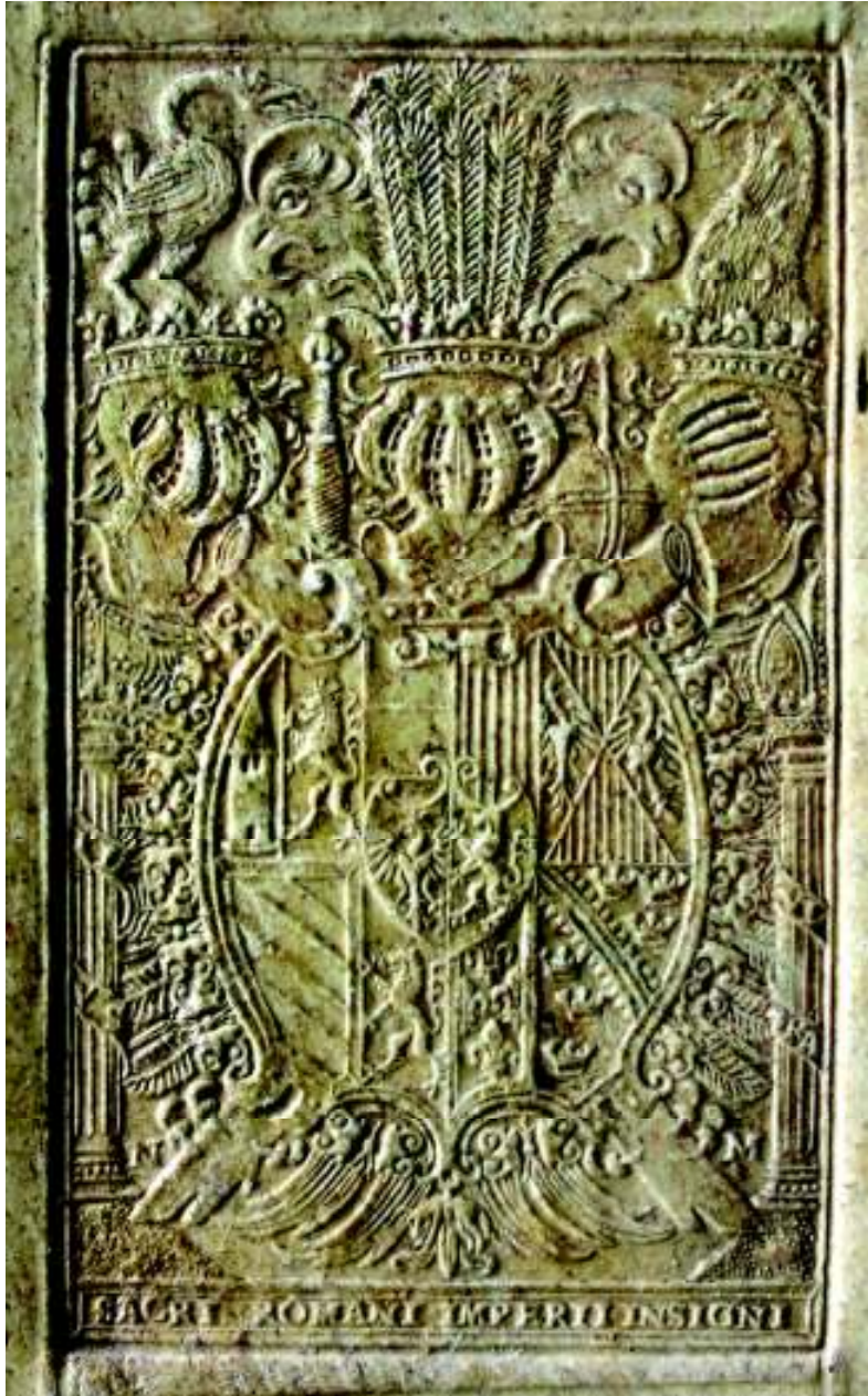
Fig. 8. Stema Sfântului Imperiu Roman (vol. II, coperta 1 sus, detaliu).