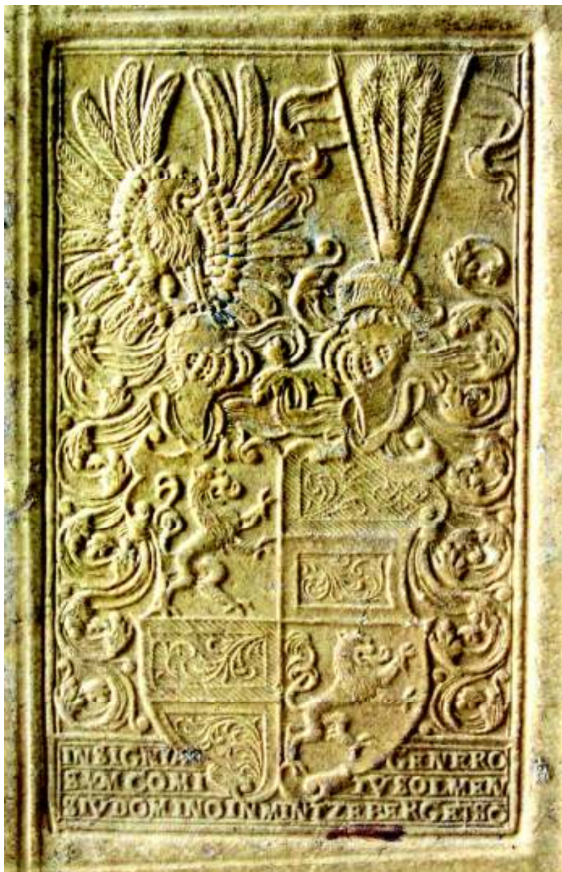
Fig. 6. Stemă neidentificată (vol. IV, coperta 2 jos, detaliu).