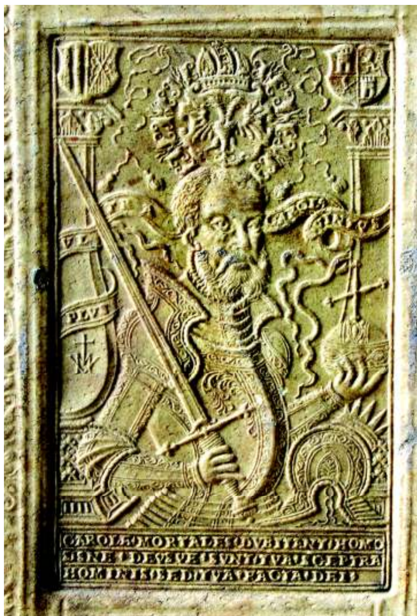
Fig. 9. Portretul împăratului Carol al V-lea (vol. IV, coperta 1 sus, detaliu).