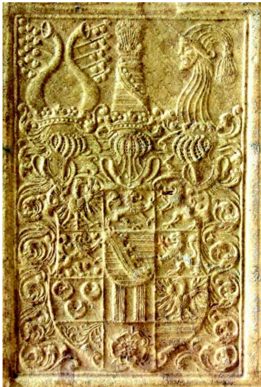
Fig. 11. Stema lui Friedrich Wilhelm, ducele Saxoniei (vol. I, coperta 1 jos, detaliu).