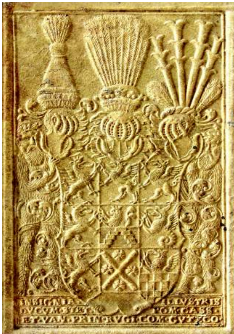
Fig. 4. Stema Pomeraniei (vol. I, copera 1 sus, detaliu).

relor părinților și scriitorilor bisericii. Texte îngrijite și studiu introductiv de/ Edited and introduced by/ Ileana Dârja, Alba Iulia, 1999, 233 p., 15 il.