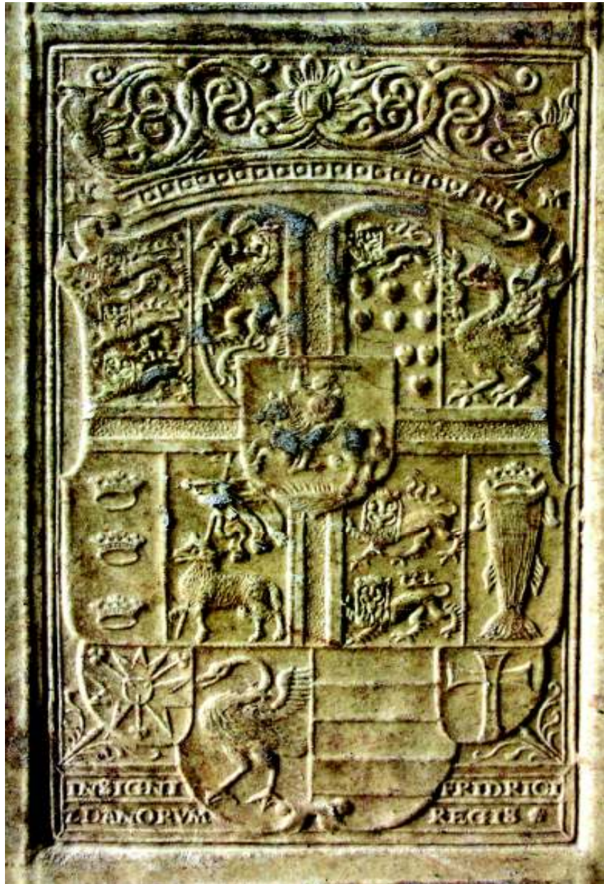
Fig. 5. Stema lui Friedrich, regele Danemarcei (vol. II, coperta 1 jos, detaliu).