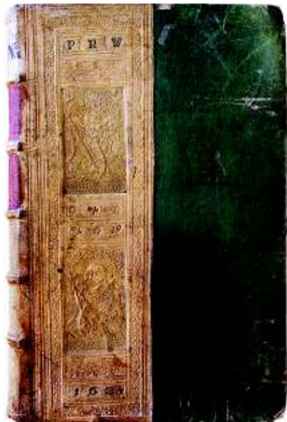
Fig. 3. Legătură, vol. 4.

Mai multe însemnări de proprietate de pe paginile de titlu ale volumelor 2, 3, 4 și 5 certifică realitatea că volumele aparțineau lui Petrus Rosinus Wurbensis încă din 19 noiembrie 1616. În 1624 același posesor își aplica monograma P[etri] R[osini] W[urbensis] și anul 1624 pe coperta 1 a volumelor 1, 2 și 4. Nu știm cui a aparținut lucrarea după această dată până la mijlocul secolului al XVIII-lea.