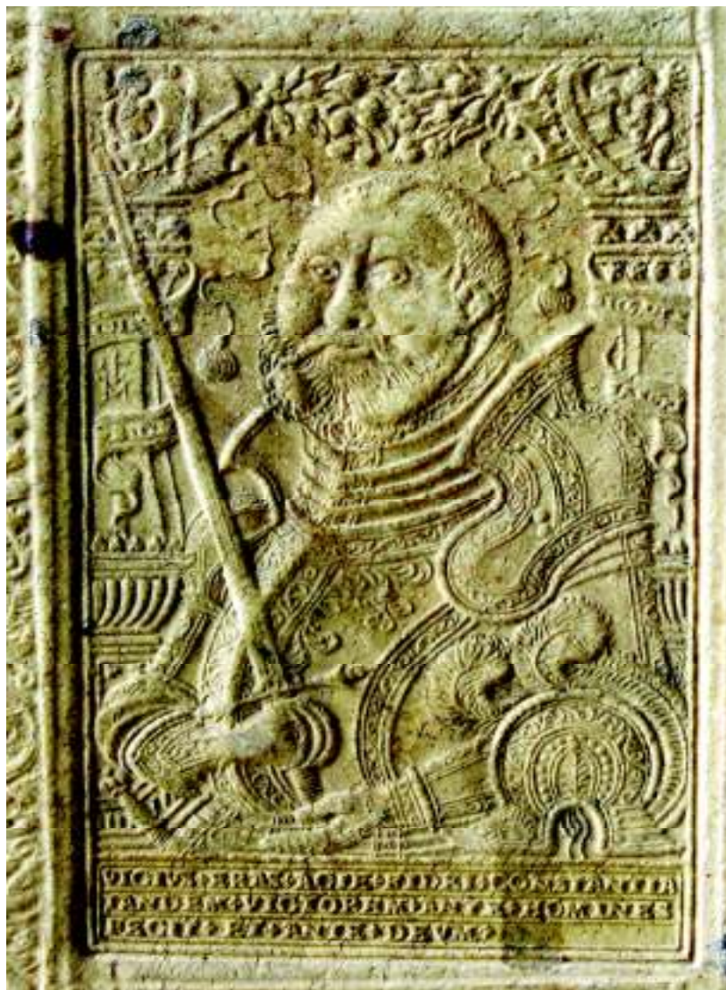
Fig. 10. Portretul lui Johann Friedrich, principele Saxoniei (vol. IV, coperta 1 jos, detaliu).

Renașterii germane semnate, care provin din 25 de ateliere, între care: Augsburg, Nürnberg, Stuttgart, Wittenberg, Würzburg; apud Muckenhaupt Erzsébet, op. cit.