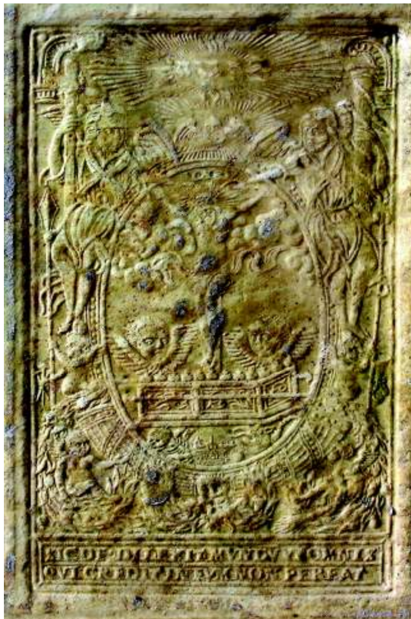
Fig. 13. Iisus crucificat și Chivotul.