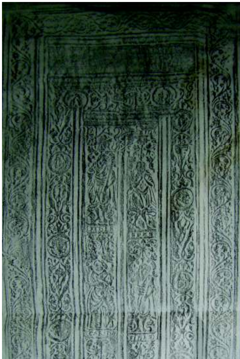
Fig. 14. Frotiul legăturii (vol. III, coperta 1, detaliu).