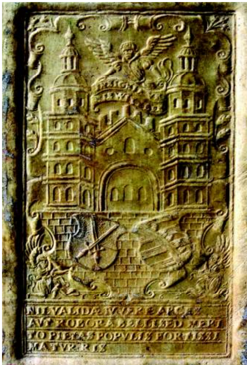
Fig. 7. Stema oraşului Wittenberg (vol. II, coperta 2 sus, detaliu).