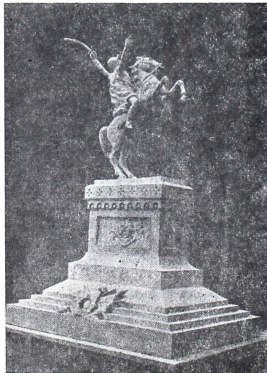
Fig. 3. Eraclie Hagiescu. Macheta monumentului „Mihai Viteazul” înaltă de 2,20 m/1,60 m expusă în palatul Jean Mihail în 1914 și răpită de trupele ocupante inamice în 1916.