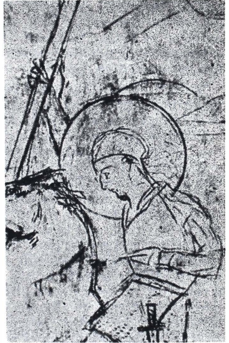
Fig. 2. Sf. Gheorghe omorînd balaurul — avînd drept model pe Tuculescu, (frescă de E. Stoenescu).