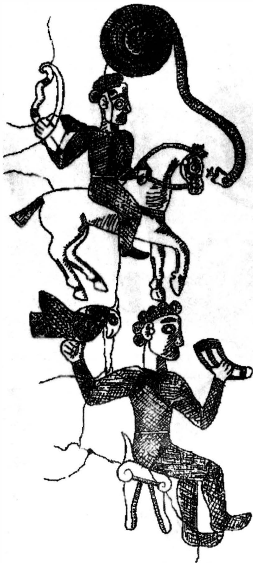
Fig. 5 Simboluri pe o cnemidă (apărător de genunchi) reprezentând pe Marele Zeu și Călărețul înarmat descoperită la Agighiol, jud. Tulcea. Reprodus după D. Berciu, Arta traco - getică, Ed. Academiei București, 1969, Buc. p. 45, fig. 13. ·