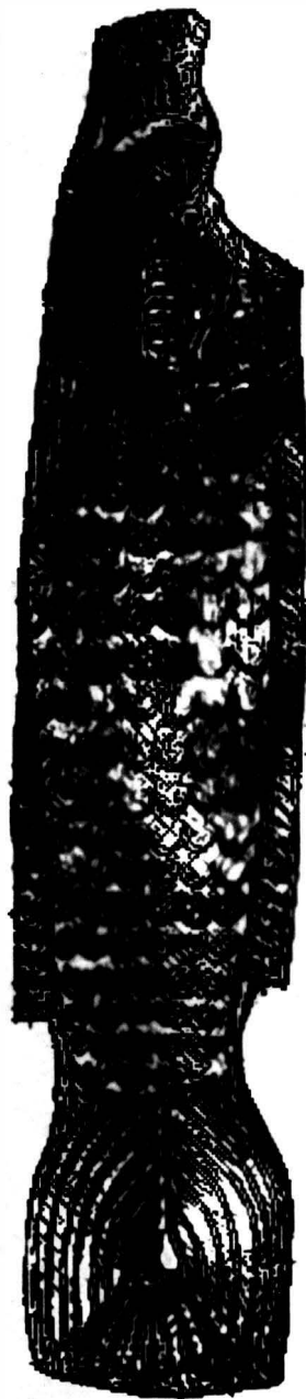
Fig. 4 Peste cu colți de mistret descoperit la Stancești, jud Botosani. Reprodus după Ion Miclea, Radu Florescu, Geto - dacii, Ed. Meridiane, Buc. 1980, fig. 40