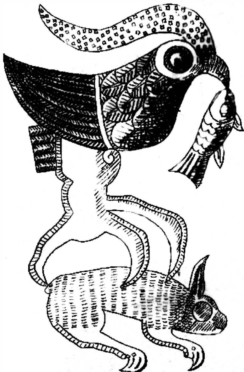
Fig. 3 Simboluri (vulturul cu corn, pește, iepure) pe unul din obrăzările coifului de la Poiana Cotofenesti