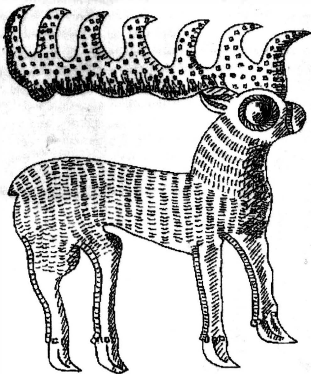
Fig. 6 Simbol animalier pe o cupă de argint, descoperită la Agighiol. Reprodus după D. Berciu. Arta traco - getică, Ed, Acad. București, 1969, Buc. p. 57, fig. 29.