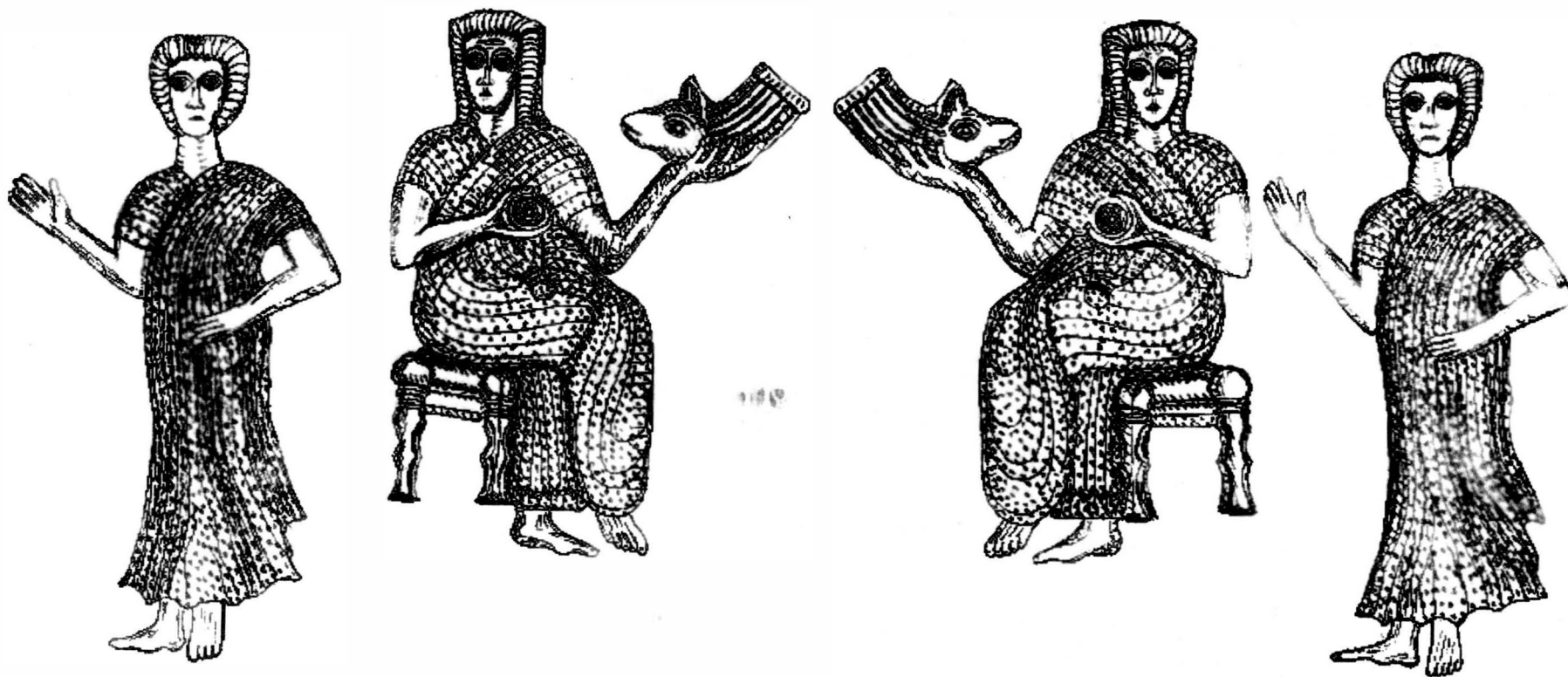
Fig. 7. Marea Zeită geto - dacică reprezentată pe rhytonul descoperit la Poroina, jud. Mehedinți.

Reprodus după D. Berciu, Arta traco - getică Editura Academiei București, 1968, Buc. p. 45, fig. 13