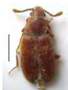
Figura 8: Adultul speciei Tribolium castaneum (segmentul reprezintă 1 mm) The Tribolium castaneum species adult (the segment represents 1 mm)

Coleoptere nocturne, tenebrionidele au mărimi diferite și culori întunecate. Antenele alcătuite din 11 articole au vârful măciucat, iar primele 3 sternite abdominale sunt sudate mai mult sau mai puțin intim. Picioarele au tarsele anterioare și medii pentamere, iar cele posterioare formate din patru articole