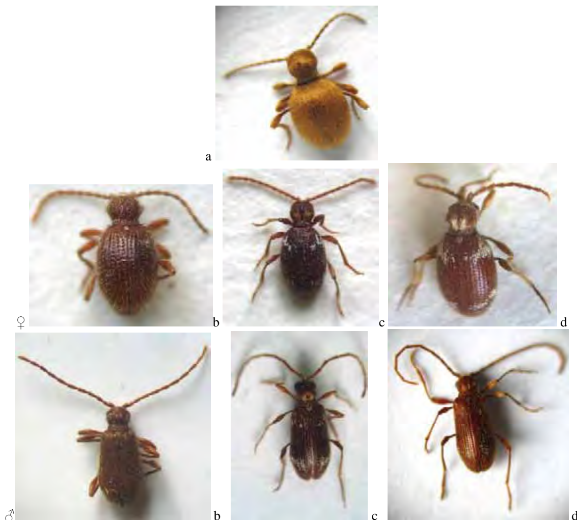
Figura 5: Adulții speciilor Niptus hololeucus (a), Ptinus brunneus (b), P. raptor (c) și P. fur (d) The adults of Niptus hololeucus (a), Ptinus brunneus (b), P. raptor (c) et P. fur (d) species

în acest cocon înainte de a ecloza, perioadă în care cuticula se întărește și are loc maturizarea sexuală. Adulții de Ptinus fur pot rămâne în cocon între 30 și 60 de zile înainte de a ecloza (HOWE & BURGESS, 1951).