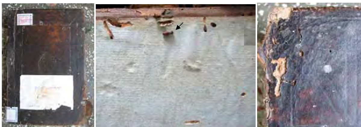
Fig. 2: Deteriorări provocate de Ptilinus pectinicornis asupra lemnului și pielii copertilor unui Penticostar (Râmnic, 1767)

În depozitul de carte veche al mănăstirii Agapia a fost semnalată specia Ptilinus pectinicornis (fig. 2), atacul fiind îndreptat asupra scoarțelor de lemn ale unui Penticostar tipărit în anul 1767 la Râmnic. Deteriorările vizibile la suprafața copertilor se concretizează în orificii și galerii în lemn în care pot fi văzuți adulți morți. Orificiile de eclozare a adulților au traversat și pielea provocând fragmentarea acesteia.