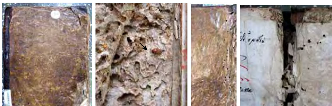
Figura 7: Atacul speciei Ptinus raptor asupra copertii de carton și a forzașului unei Antologhii (Mănăstirea Neamț, 1840) The Ptinus raptor species attack to a binded cover and to an – Antology flyleaf (Monastery of Neamț, 1840)

În cercetările efectuate am semnalat atacul ptinidelor în special asupra coperților de carton și a pielii care le acoperă, precum și asupra hârtiei din apropierea legăturii. La suprafața volumelor pot fi observate orificiile de zbor ale adulților care au părăsit substratul (figura 7). Cartonul vechi, material ce conține atât celuloză cât și clei de proveniență animală, este un substrat preferat de Ptinidae. Larvele acestora îl străbat sapând galerii în grosimea coperților, galerii cu aspect neregulat și pline cu excremente și resturi de exuvii larvare. În carton, la capătul galeriei de hrănire, larvele își construiesc coconii de împupare din particule luate din mediu și mătase secretată de ele. Aici adulții ies din coconi și încearcă să evadeze din substrat pentru a se împerechea, unii dintre ei însă nu reușesc și mor în galerii (fig. 6 și 7).