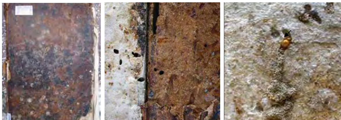
Figura 6: Atacul combinat a trei specii de Ptinidae ( Ptinus raptor , P. fur și Niptus hololeucus ) asupra copertii, hârtiei și pielii și adultul speciei Niptus hololeucus în galerie în carton - Ceaslov (1817) The combined attack of three species of Ptinidae ( Ptinus raptor , P. fur et Niptus hololeucus ) to covers, paper and skin and the adulte of Niptus hololeucus species in a binding gallery– Ceaslov (1817)

În cercetările efectuate am semnalat atacul ptinidelor în special asupra coperților de carton și a pielii care le acoperă, precum și asupra hârtiei din apropierea legăturii. La suprafața volumelor pot fi observate orificiile de zbor ale adulților care au părăsit substratul (figura 7). Cartonul vechi, material ce conține atât celuloză cât și clei de proveniență animală, este un substrat preferat de Ptinidae. Larvele acestora îl străbat sapând galerii în grosimea coperților, galerii cu aspect neregulat și pline cu excremente și resturi de exuvii larvare. În carton, la capătul galeriei de hrănire, larvele își construiesc coconii de împupare din particule luate din mediu și mătase secretată de ele. Aici adulții ies din coconi și încearcă să evadeze din substrat pentru a se împerechea, unii dintre ei însă nu reușesc și mor în galerii (fig. 6 și 7).