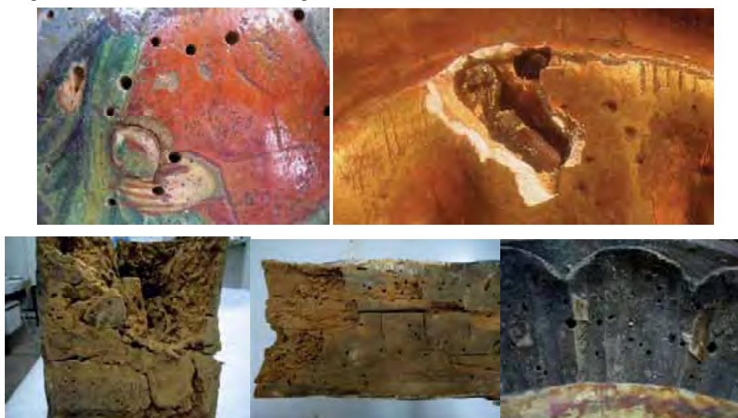
Fig.3 Deteriorări provocate de anobiide asupra iconostasului bisericii de cimitir „Sf. Ioan”, Agapia Impairing caused by anobiides to the iconostasis of the „Sf. Ioan” Agapia cemetery church,

La iconostasul bisericii de cimitir s-a constatat un atac activ de anobiide. Intensitatea atacului diferă de la un registru la altul sau de la un fragment de lemn la altul. Cele mai degradate piese din iconostas au fost stâlpii decorativi din registrul inferior al icoanelor de poală, la care s-a semnalat prezența speciilor Anobium pertinax și Xestobium rufovillosum (figura 3). Galeriae sunt neregulate, având diametrul de până la 3,5 mm. Prin orificiile de la suprafață se scutura rumegușul proaspăt din galerii. Prezența insectei X. rufovillosum este trădată și de excrementele aplatizate, cu diametrul de până la 1 mm, caracteristice acestei specii.