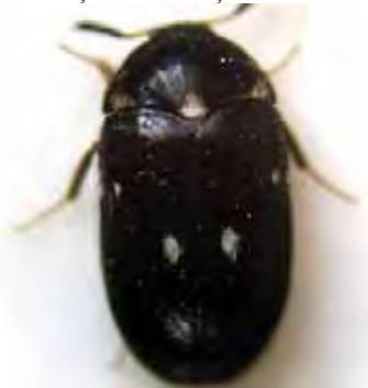
Figura 4: Attagenus pellio – adultul (♂) Figure 4: Attagenus pellio – the adult (♂)

Adultul speciei Attagenus pellio prezintă pe pronot trei pete bazale alcătuite dintr-o pubescență albă, iar elitrele au pe linia mediană câte o pată discoidală de peri albi. Corpul, lung de 3,5 – 6 mm, este acoperit ventral cu peri cenușii. La această specie cele două sexe pot fi diferențiate foarte ușor după structura antenei. Larva este alungită și are pe ultimul segment abdominal un smoc de peri lungi care pot atinge la larva matură 5-6 mm. Ciclul biologic variază în limite largi, în funcție de condițiile de mediu și substratul nutritiv, larva suferind în mod obișnuit 4 -5 năpârliri.