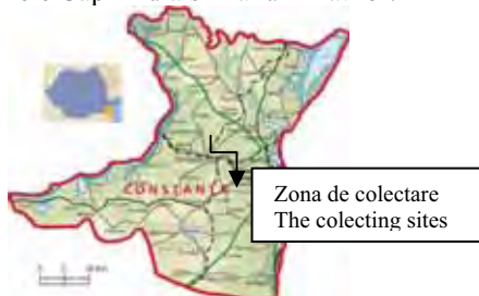
Fig.1 Harta jud. Constanța (incluzând și zona costiera) The jud. Constanța map (including the seashore region)

Exemplarele colectate și aduse la Acvariu, înainte de a fi repartizate în bazinele expoziționale, au fost selectate, determinate și numărate.