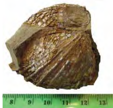
Figure 6. Tauricardium baraci (BRUSINA) 1884