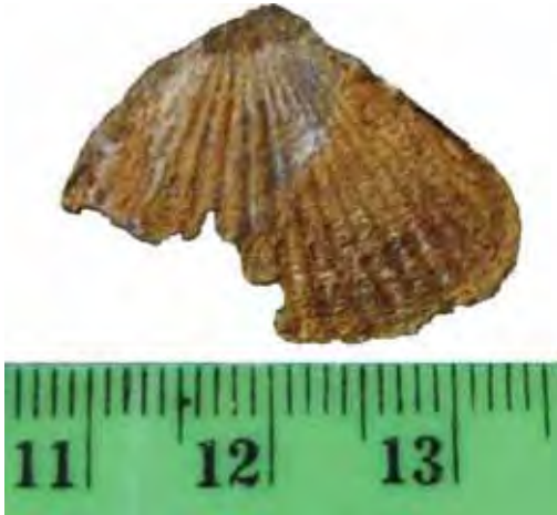
Figure 3. Plagiodacna carinata (DESHAYES) 1838