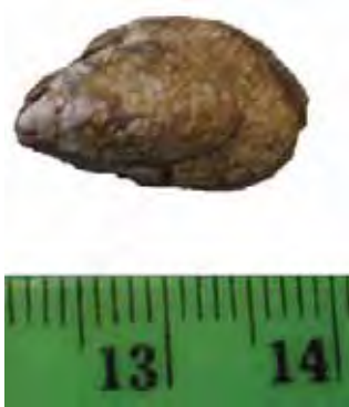
Figure 1. Dreissena rostriformis (DESHAYES) 1838