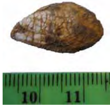
Figure 2. Dreissena rimestiensis (FONTANNES) 1886