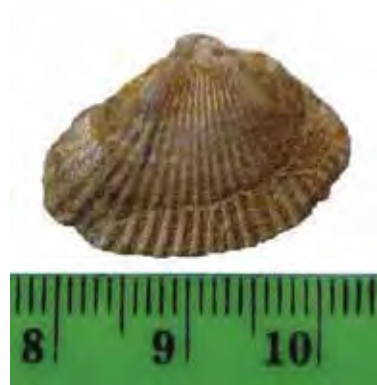
Figure 4. Pontalmyra subcarinata (DESHAYES) 1838