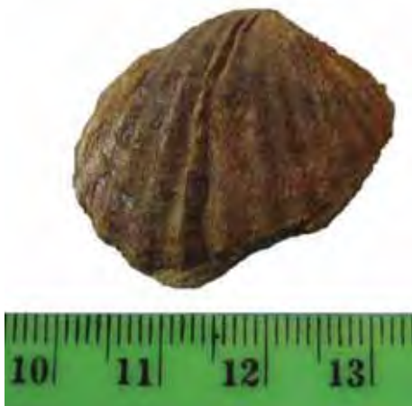
Figure 5. Tauricardium peterssi nassirica EBERZIN, 1947