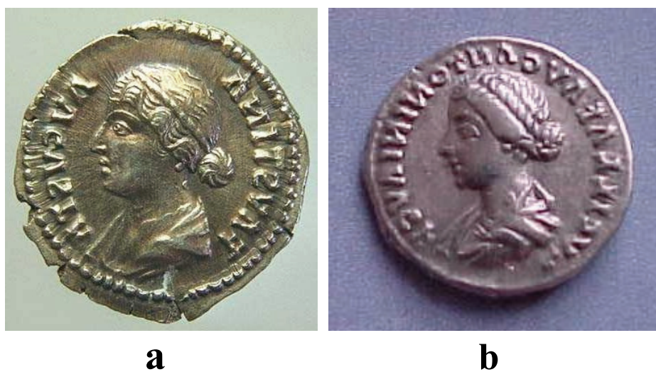
Fig. 2. Monede imperiale romane: a) reprezentare a împărătesei Faustina Minor pe o monedă de bronz; b) reprezentare a Anniei Lucilla pe o monedă de argint.