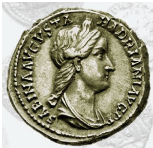
Fig. 4. Reprezentare a împărătesei Vibia Sabina pe o monedă de bronz.