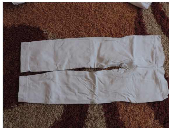
Pantaloni bărbătești (sec. XX) – Feldru.