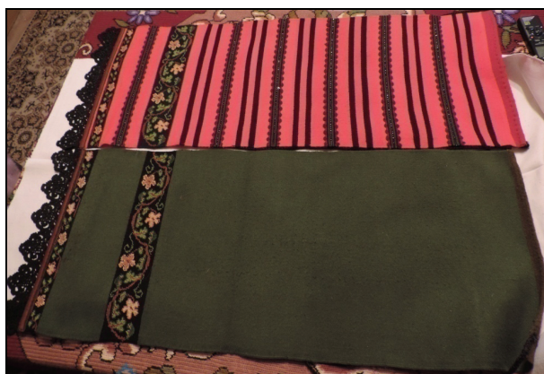
Catrințe față-spate (înc. sec. XX) – Mocod.

În perioada 16 – 19 august 2016 am efectuat o cercetare de teren în zona fostului Regiment de graniță năsăudean. Scopul acestei cercetări a fost acela de a căuta elemente vechi de port popular, păstrate în lăzile de zestre ale localnicilor. Am identificat și fotografiat 369 de elemente ale vechiului costum popular local, prin vizite efectuate la localnici. Localitățile vizitate au fost: Mocod, Năsăud, Sângeorz-Băi, Maieru, Rodna. Am considerat util să inserez și câteva fotografii – rezultate ale acestei cercetări asupra portului tradițional local din zona Regimentului de graniță năsăudean ca mărturii recente ale păstrării unora dintre elementele de identitate grănicerească de peste 160 de ani.