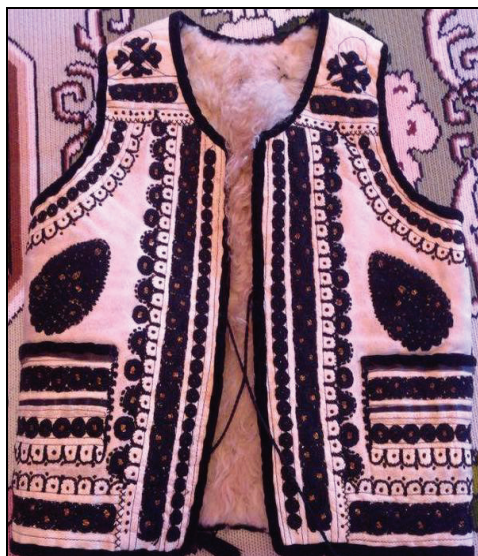
Piețtar bărbătesc (sec. XX) – Feldru.