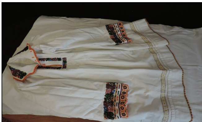
Cămașă bărbătească (sec. XX) – Feldru.