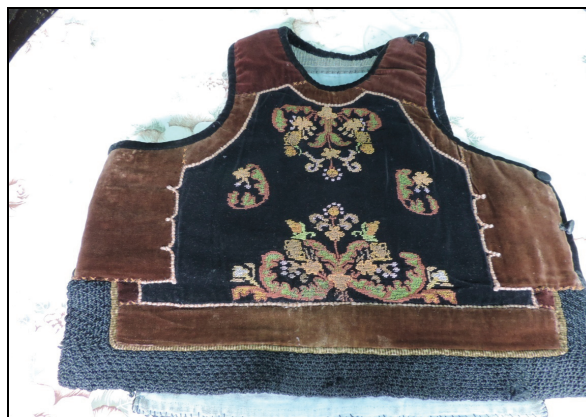
Pieptar femeiesc înfundat (înc. sec. XX) – Mocod.