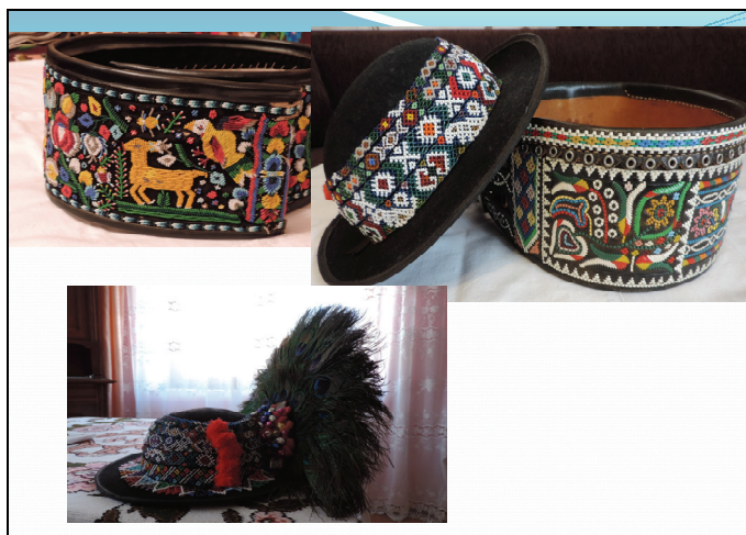
Chimire și pălărie cu pană de păun – Sângeorz-Băi.