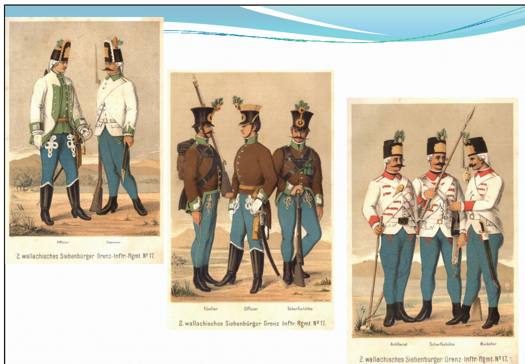
Uniforme de soldați ai Regimentului II românesc de graniță.

În continuare vă prezentăm câteva fotografii cu uniforme de soldat, după istoricul german Gustav Ritter von Treuenfest.