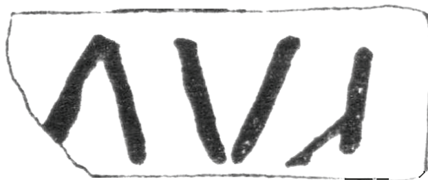
Fig. 3. Țiglă cu șampilă legiunii a V-a Macedonica descoperită în castrul de la Slăveni (desen, după IDR, II).

La o primă vedere ar fi tentant să corelăm inscripția funerară reutilizată la porta praetoria a castrului de la Slăveni, cu țiglele șampilate ale legiunii a V-a Macedonica 25 descoperite în castru (fig. 3-4). Asta ar însemna cumva o acreditare a prezenței unui detașament al legiunii a V-a Macedonica, la Slăveni. Dar drept este și faptul că între această inscripție și țiglele șampilate de cărămidarii legiunii, nu este obligatoriu să existe neapărat o relație.