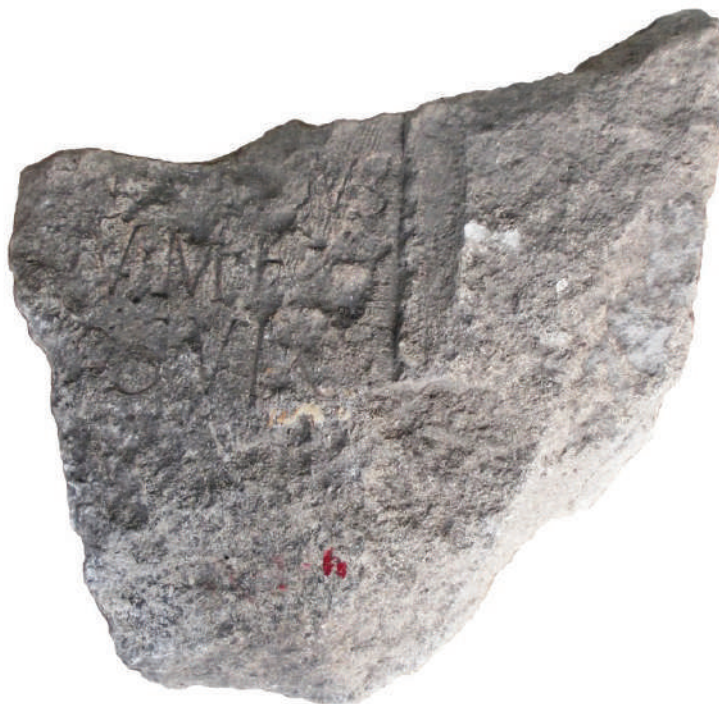
Fig. 1. Inscripția unui fost beneficiar consular, veteran al legiunii a V-a Macedonica, descoperită în porta praetoria a castrului Slăveni.

Examinarea carnetelor de săpături ale profesorului D. Tudor redactate pe șantierul arheologic Slăveni 5 , mi-a relevat faptul că inscripția respectivă a fost descoperită în acest castru, în timpul săpăturilor arheologice din anul 1975. Piesa a fost practic găsită în zidăria porții praetoria a castrului, fiind reutilizată acolo ca material de construcție.