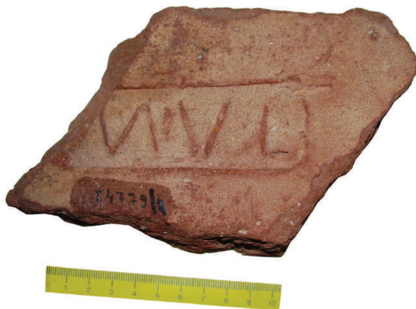
Fig. 4. Fragment de țiglă cu ștampila legiunii a V-a Macedonica, descoperită în castrul de la Slăveni (foto după Bondoc, 2010).