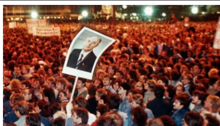
Sute de mii de oameni demonstrând la Leipzig la 24 octombrie 1989 pentru mai multă democrație, drepturi cetățenești și reforme în RDG.

grup de 30 de intelectuali, a organizației „Noul Forum”; „căderea” Zidului Berlinului la 9 noiembrie. La momentul respectiv, toate acestea erau privite, atât de către factorii implicați cât și de observatorii politici externi, ca pași importanți în direcția reformării comunismului din statul est-german și în nici un caz ca semnale ale sfârșitului acestuia. Neclarificate au rămas până în prezent locul și rolul opoziției, în accepția menționată mai sus, în derularea revoluției pașnice.