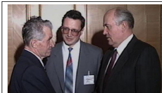
Nicolae Ceaușescu și Mihail Gorbaciov în mijloc Ceslav Ciobanu.

1. Mijlocul verii anului 1989 începea abrupt printr-o întâlnire la București, în zilele de 7- 8 iulie, a Comitetului Politic Consultativ al statelor participante la Tratatul de la Varșovia (OTV). Această reuniune, ultima de o asemenea anvergură în istoria Pactului, a fost consacrată situației internaționale și s-a încheiat cu documentul intitulat „ Pentru o Europă a stabilității și în securitate, fără arme nucleare și chimice, pentru reducerea substanțială a forțelor armate, armamentelor și cheltuielilor militare ”.