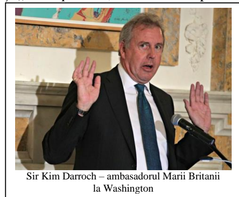
Sir Kim Darroch – ambasadorul Marii Britanii la Washington

1. Astfel, după cum reiese din raportările lui Kim Darroch, încă din anul 2017, informațiile sale s-au referit doar la aspectele critice privind funcționarea și inițiativele Administrației Trump, o mare parte fiind similare și în concordanță cu atacurile la care este supus actualul președinte și colaboratorii săi republicani de către politicienii democrați și mass-media progresistă. Astfel, la puțin timp după instalarea lui Donald Trump la Casa Albă, Kim Darroch evalua într-o telegramă trimisă la Londra: „Nu cred că această administrație va deveni substanțial mai normală, mai puțin disfuncțională, mai puțin imprezvizibilă, mai puțin divizată, mai puțin stângace și ineptă din punct de vedere diplomatic” . Președintele american este „instabil” și „incompetent” , mai estima diplomatul în altă telegramă.