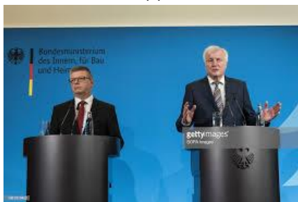
Horst Seehofer și Thomas Haldenwang (stânga)

Conform raportului, serviciile de informații străine, în special din Turcia, Siria, Iran și Pakistan și-au intensificat activitățile în Germania, în ultimele 12 luni.