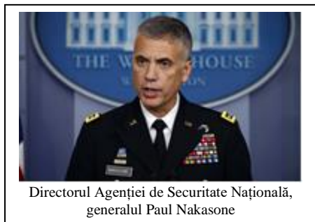
Directorul Agenției de Securitate Națională, generalul Paul Nakasone

„ Implicarea ofensivă înseamnă să dispui de capacități și să acționezi ”, a declarat Nakasone. Anul trecut, când a preluat conducerea agenției, acesta a afirmat că inamicii nu se tem de Statele Unite în spațiul cibernetic, iar intenția sa era de a schimba acest lucru.