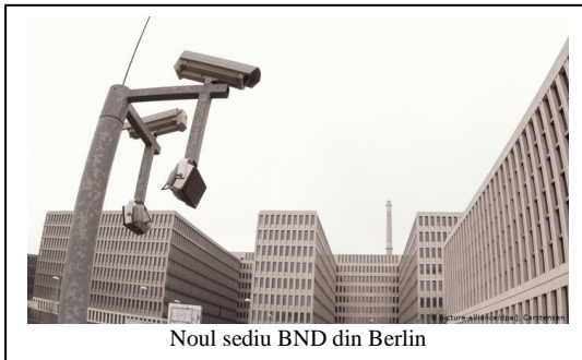
Noul sediu BND din Berlin

La data de 8 februarie 2019, în prezența cancelarului federal Angela Merkel, a avut loc ceremonia de inaugurare a noului sediu al Bundesnachrichtendienst (BND), situat în zona centrală Lichterfelde din Berlin. Acest eveniment a fost așteptat mai bine de 16 ani de la hotărârea politică de mutare a sediului BND la Berlin (2003-2019), din localitatea Pullach de lângă München, în landul Bavaria, unde a funcționat din 1956. De altfel, serviciul de spionaj german a avut sediul în Pullach încă din 1947, de la înființarea „Organizației Gehlen”, predecesoarea BND.