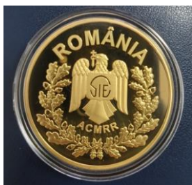
AVERSUL Plachetei aniversare