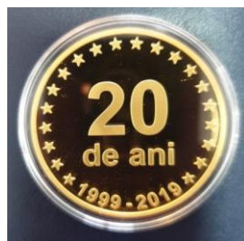
REVERSUL Plachetei aniversare