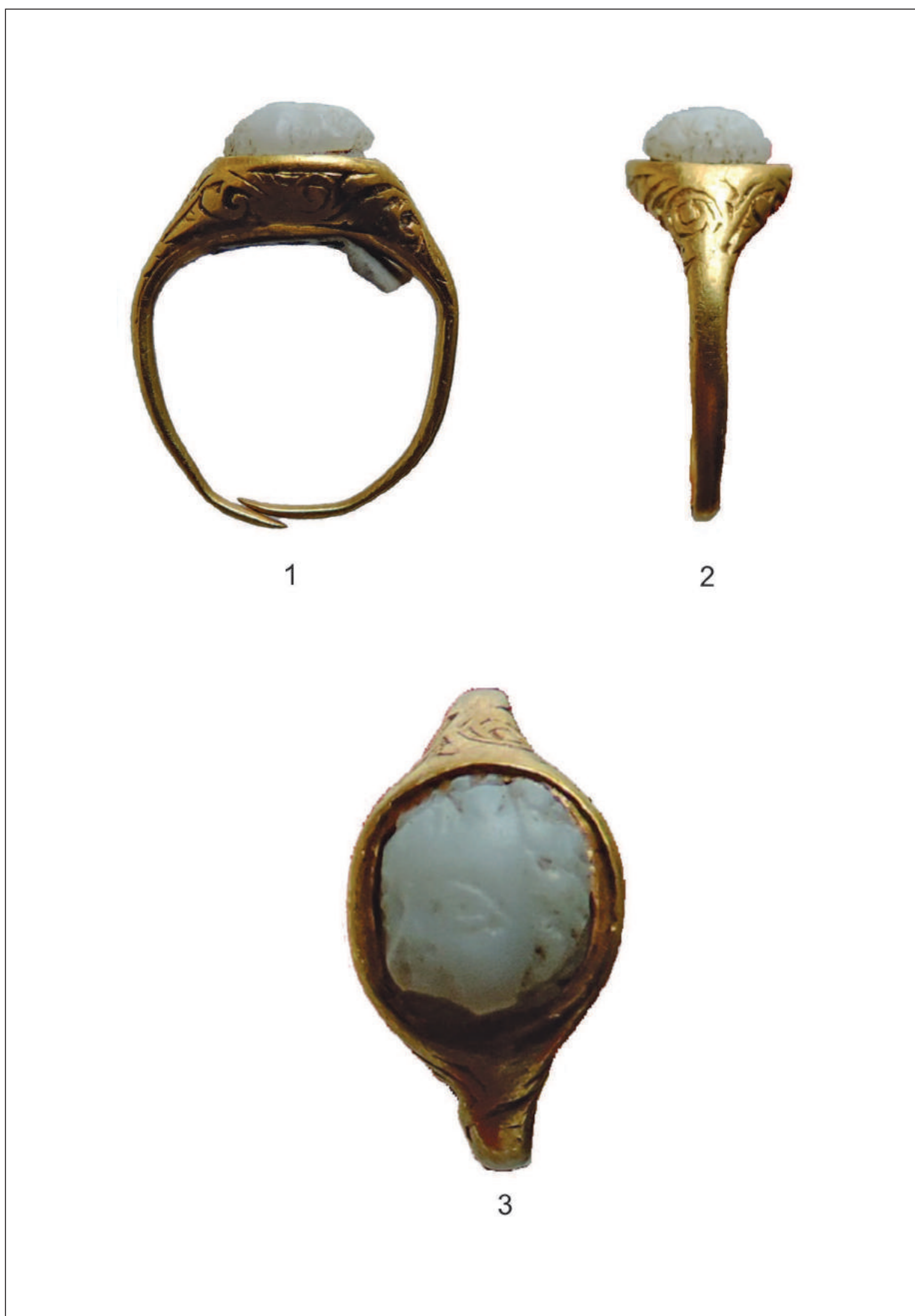
Pl. II. Inelul medieval cu camee romană descoperit în cripta 6 a bisericii medievale din Caransebeș, MJERGC nr. inv. 14170