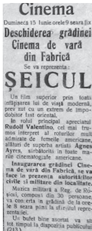
Fig. 6 Reclamă la Cinematograful de Vară din Fabrică, apud Voința Banatului, Timișoara, an IV, nr. 24, 1924, 3.