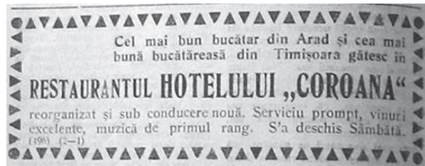
Fig. 3 Reclamă la Restaurantul Hotelului Coroana, apud Voința Banatului, Timișoara, an V, nr. 67, 1924, 4.