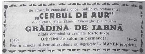
Fig. 2 Reclamă la Restaurantul Cerbul de Aur, apud Voința Banatului, Timișoara, an V, nr. 79, 1925, 4.