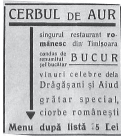
Fig. 1 Reclamă la Restaurantul Cerbul de Aur, apud Fruncea, Timișoara, an II, nr.5, 1935, 5.