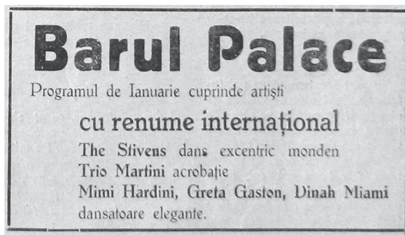
Fig. 4 Reclamă la Barul Palace, apud Fruncea, Timișoara, an III, nr. 2, 1936, 5.