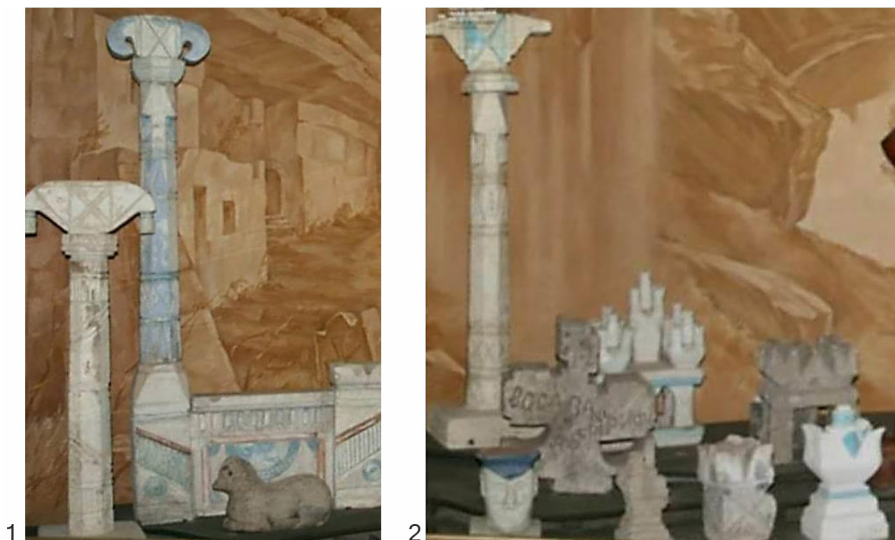
Fig. 2. 1-2. Materiale de piatră prelucrate de Alexandru Lisnic, aflate în colecția Muzeului Național de Etnografie și Istorie Naturală din Chișinău (după Guțu 2019).