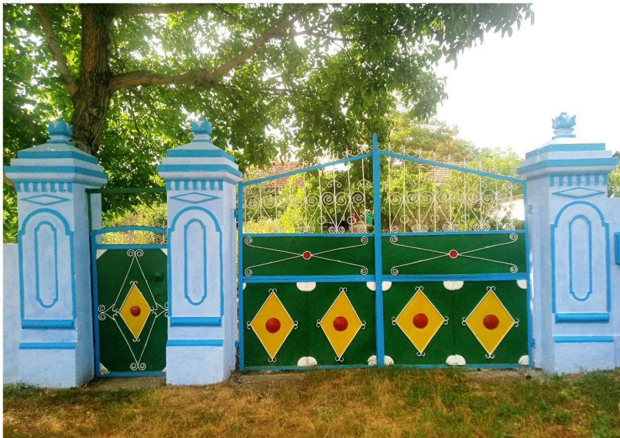
Fig. 1. Poarta familiei Cebotari Gheorghe și Valentina din Brănești, construită de meșterii din localitate.