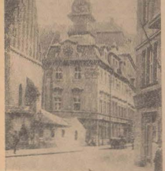
Sinagoga Altrite și Comunitatea Evreilor din Praga

Această acțiune a pornit din inițiativa Mar- tei Feuchtwanger, văduva marelui scriitor. Între una din săliile muzeului evreiesc din Praga au fost expuse o serie de documente de o valoare excepțională pentru studiul con- tribuției scriitorilor evrei din Evul Mediu la dezvoltarea științelor medicale, matematicii și geografiei, ca de pildă: lucrările istori- cilor și astronomilor David Gans (1541— 1613), al filozofului și astronomului Isac Debenberg de Kendia (1591—1656) și alie leluda Ibrahîm Ben Benasi (mort în 1608). Tindu asupra de importanța acestui mu- zeu, guvernul cehoslovac l-a trecut de la 1 ianuarie 1964 sub auspiciile Ministerului de Învățământ și Cultură. Pînă în această dată Muzeul se afla în grija Statului Național al orașului Praga.