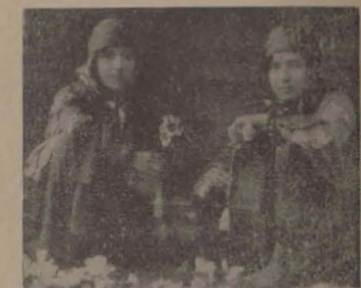
Doi evreici originari din Persia, în costum tradițional, ținecî lîna

În locuințele lor, pline de cocoare persane, majoritatea „Jedid”-imilor păstrează felul de viață din orașul de origine; între ei vorbesc numai persana și găsesc mîncărurile tot după moda orientală. „Jedid”-imii sînt foarte