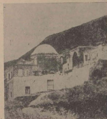
Monumentul lui Șimon Bar Iohai, la care an de an de Lag Baomer vin mii de pelerini evrei din toate colțurile lumii

Lată de pildă, de cîrind am recapitulat povestea ieșirii din Mișraim și am făcut să a pară pe mesele noastre, simbolurile robiei și ale libertății. O clipă a apărut în viziunea noastră leagănul existenței noastre ca popor. Dar chiar a doua zi după Seder începem, cu aceeași punctualitate, conform Luahului, să numărăm Sefira. O facem de obicei în chip mecanic, pentru că așa am preluat-o de la străbuni, sau pentru că așa ne indică sfîntele noastre cărți de rugăciuni. Dacă ne străduim însă și aruncăm o privire mai a-