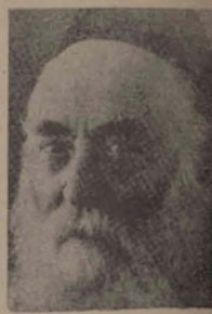
הרב ר' איסר יהודה אונגערמאן שליט"א