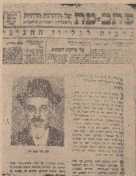
עמוד עברי זה של כתבי-עת שלנו הופיע ביהודון, עם וספר"י ישיבירשלים.