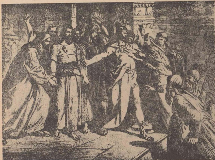
Prinderea lui Irmiahu — ilustrație la o ediție veche a bibliei

Profețiile lui Irmiahu au avut loc pe un fundal istoric bine determinat. Regatele lui Iuda și Israel erau prinse între doi giganti: Egiptul și Babilonul. Fiecare dintre aceste mari puteri, în lupta pe care o ducea una contra celeilalte, trebuia să aibă controlul acelei căi strategice pe care o reprezenta Palestina; în cadrul acestei înclăștări a gigantilor, diferite fracțiuni din poporul evreu luau parte uneori sau alături dintre beligeranți. Irmiahu, pentru motive bine întemeiate socotea că evreii pot găsi salvarea alăturin-