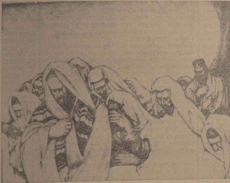
Iom-Kipur. Desen de Saul Raskin.

Ierusalim 3 MENAHEM AV 5724 12 iulie 1964