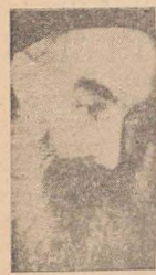
הרב ר' יהודה לייב לוי שליט"א רב הראשי של מוסקבה