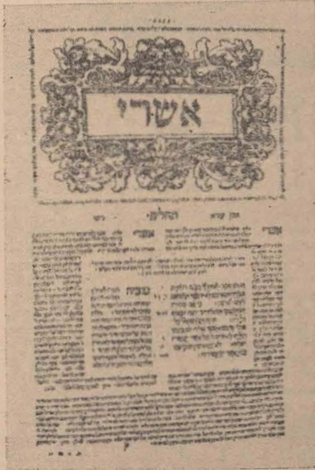
Prima pagină din „Cartea Psalmilor”, din cea de a doua ediție a Bibliei editată de Daniel Bomberg (Veneția 1524—1525).

conținutul rămîne mereu același: „Căci su-flețul meu este sătul de obidă și viața mea este aproape de mormînt”. Acest psalm nu este numai un protest împotriva sule-riinței dar și un aspru dialog cu Acela care îngăduie permanentizarea nedreptății: „Oare în mormînt va istorisi cineva mila