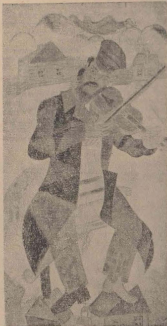
Chagall: ilustrații la Șalom Aleichem

Totuși, oricît de ciudat ar părea aceasta, dacă Chagall încarcă pictura religioasă, o face mai mult prin felul său de a picta, prin blîndețea culorilor și a formelor, prin fervoarea tablourilor sale, prin forța evocatoare cu care își tratează subiectele decît prin imperativele vreunei religii anume. Desigur, originea și educația și-au pus amprenta pe această personalitate remarcabilă. Evreu născut pe pămînt slav, el a luat de la cele două rase caracteristicile artei sale: misticismul, o sensibilitate ascuțită, un simț poetic de o minunată prospețime, o fantezie continuă trează, un interes pasionat pentru viața celor umili în ceea ce are ea atrăgător și poetic: un gust al culorii pentru culorile, care îi permite să se exprime integral în nuanțe de o infinită delicatețe, o îndrăzneală în compoziție care îi deschide porțile lumilor celor mai