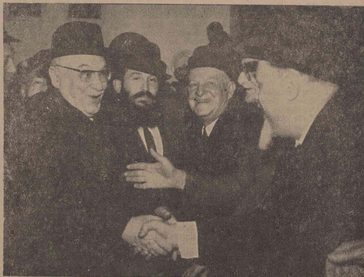
Președintele statului Israel întîmpină călduros pe d. Șef rabin dr. Moses Rosen

דער פרעזידענט פון מדינת ישראל נעמט ווארעם אונז דעם רב משה רוזן.